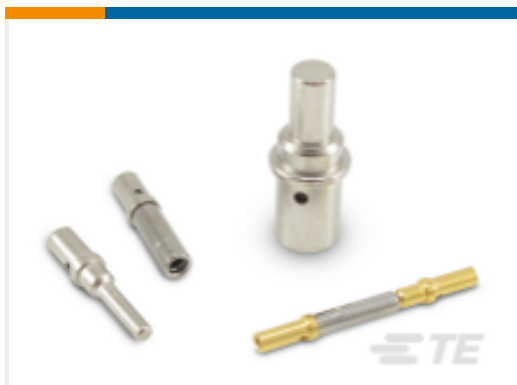
TE 产品编号0462-201-20141 DEUTSCH 实芯端子