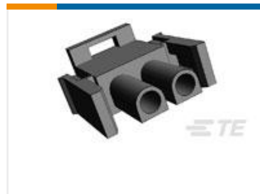
TE 产品编号1-480698-0 02P UMNL PLUG HSG NATL