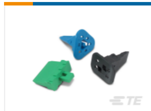
TE 产品编号W6P DEUTSCH DT 楔形锁紧装置