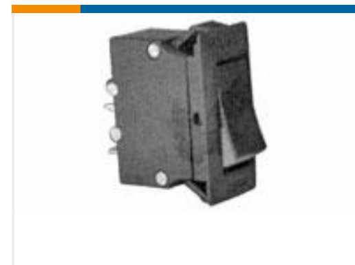
TE 产品编号1-1423673-8 W51-A151A1-15=CKTBKR,THERM, ROC