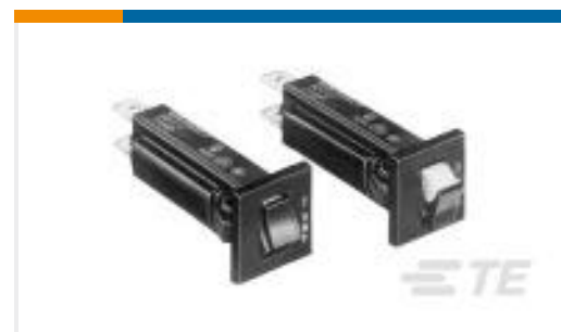
TE 产品编号1-1393250-7 W28-XQAT-15=W28