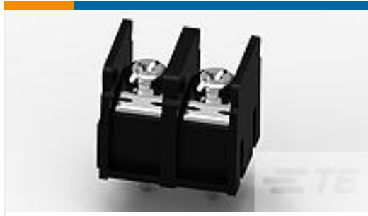
TE 产品编号1977477-2 Module Dual Barrier, .325 CL, 2 Pos.