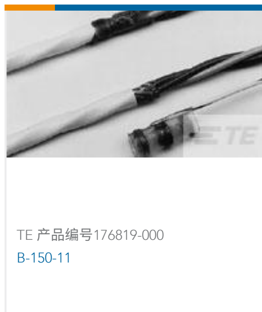
TE 产品编号176819-000 B-150-11