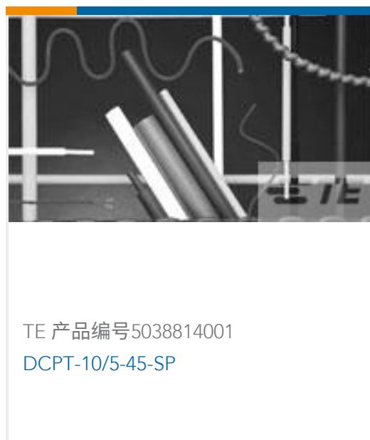
TE 产品编号5038814001 DCPT-10/5-45-SP