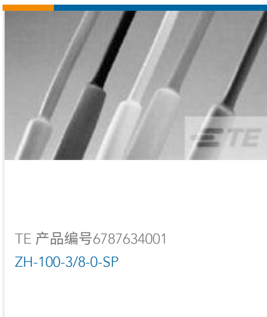
TE 产品编号6787634001 ZH-100-3/8-0-SP