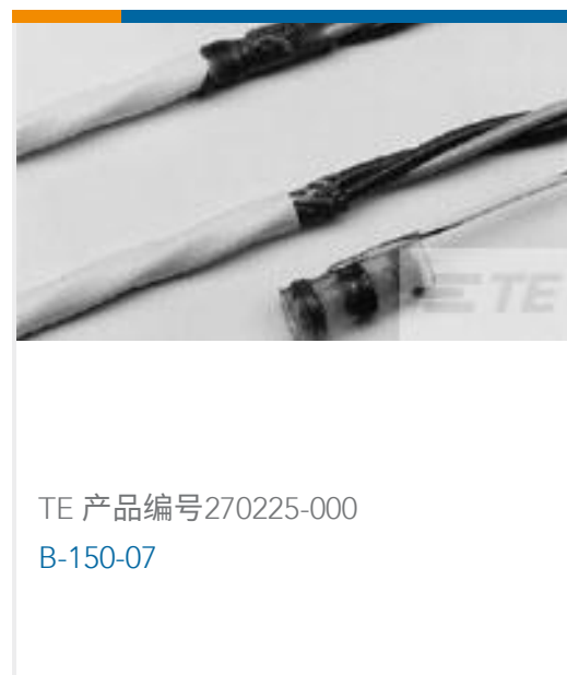
TE 产品编号270225-000 B-150-07