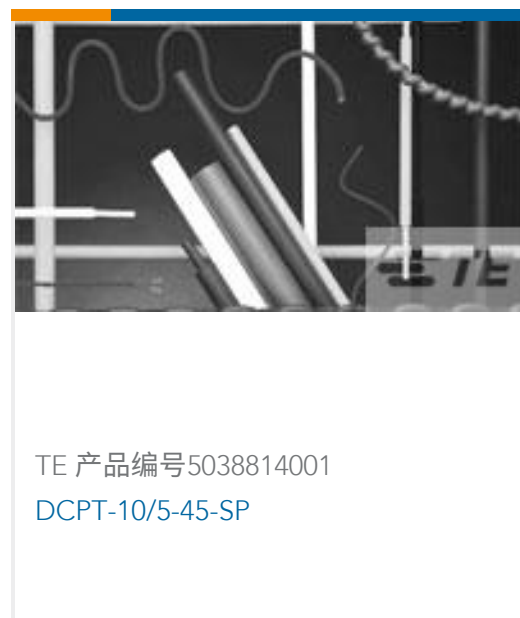
TE 产品编号5038814001 DCPT-10/5-45-SP