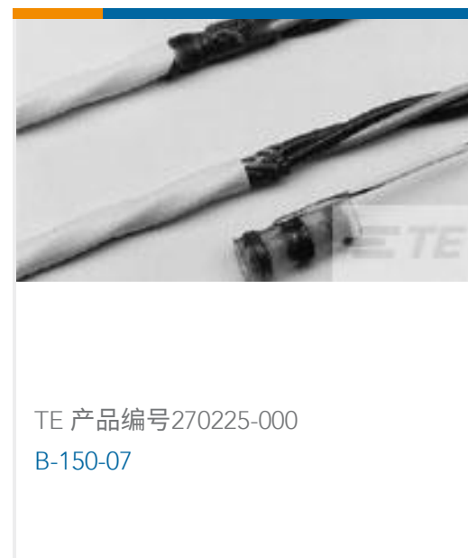
TE 产品编号270225-000 B-150-07