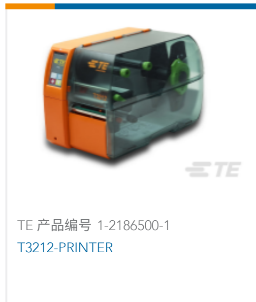
TE 产品编号 1-2186500-1 T3212-PRINTER