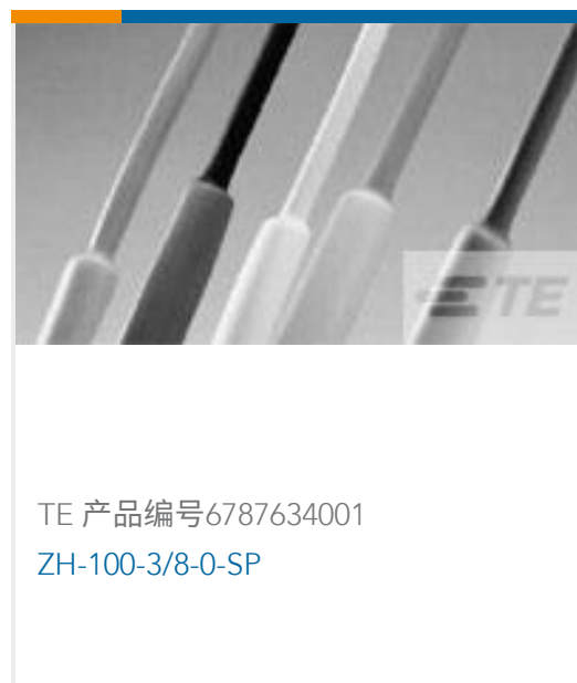
TE 产品编号6787634001 ZH-100-3/8-0-SP