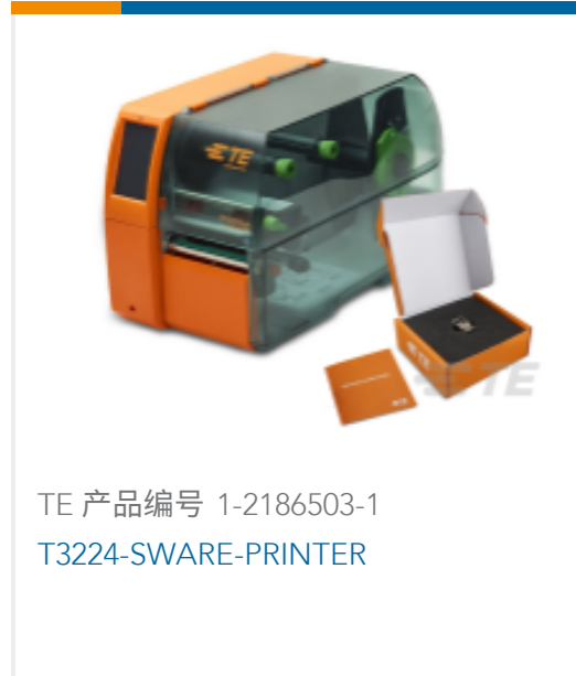
TE 产品编号 1-2186503-1 T3224-SWARE-PRINTER