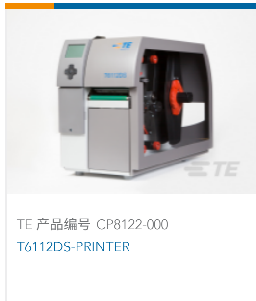
TE 产品编号 CP8122-000 T6112DS-PRINTER