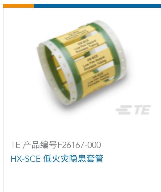
TE 产品编号F26167-000 HX-SCE 低火灾隐患套管