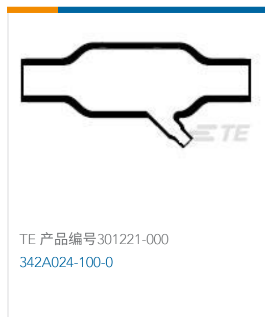
TE 产品编号301221-000 342A024-100-0