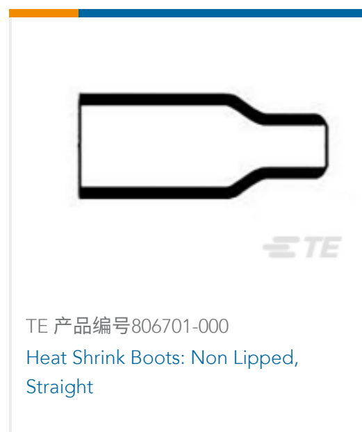
TE 产品编号806701-000 Heat Shrink Boots: Non Lipped, Straight