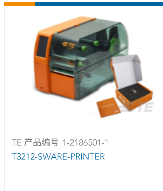
TE 产品编号 1-2186501-1 T3212-SWARE-PRINTER