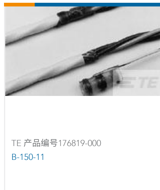
TE 产品编号176819-000 B-150-11