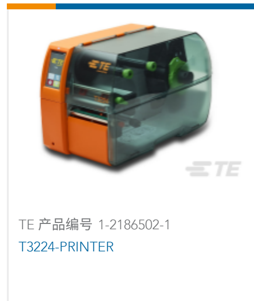
TE 产品编号 1-2186502-1 T3224-PRINTER