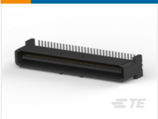
TE 产品编号1-5120525-1 Free Height Plug Connector: Board-Board, Vertical, 64, 1mm