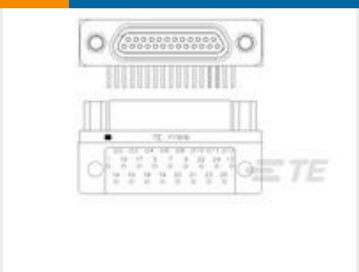
TE 产品编号1532261-1 M83513/13-D01CN = MCKS-C2-B-25SRT1