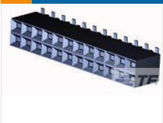
TE 产品编号1-147105-2 24 MODIV VRT DR SFMNT 30AU