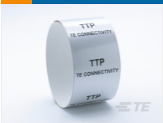
TE 产品编号390342-000 TTP 连续聚酯标签贴花