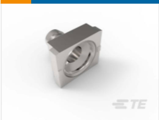
TE 产品编号1-2308349-2 用于 1-3STD/1-4QL 尺寸外壳的压接凸缘