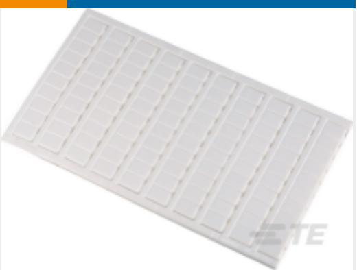
TE 产品编号1SNK169002R0000 MC812PA L1-L2-L3-N-PE (x20) Vertical