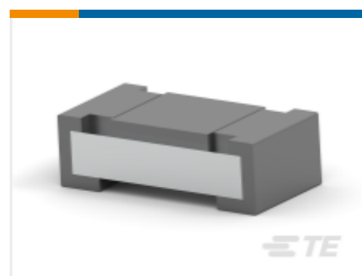
TE 产品编号1-2176055-6 厚膜电阻器：电流感应