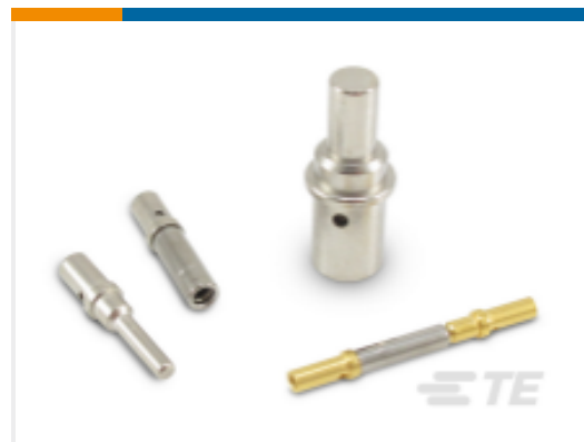
TE 产品编号0462-201-20141 DEUTSCH 实芯端子