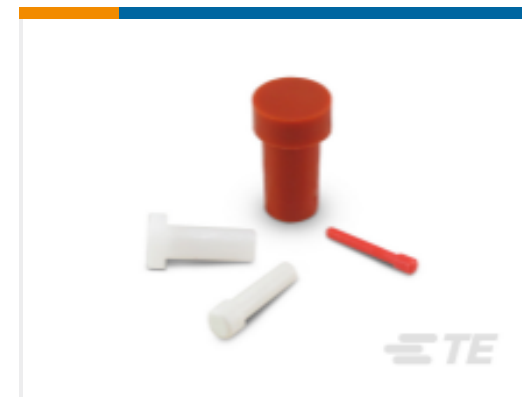
TE 产品编号114017-ZZ DEUTSCH 密封盲堵