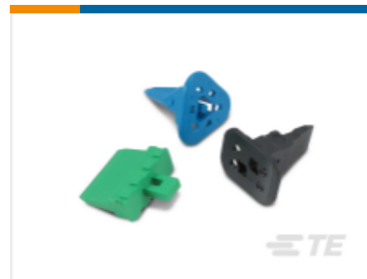
TE 产品编号W6P DEUTSCH DT 楔形锁紧装置