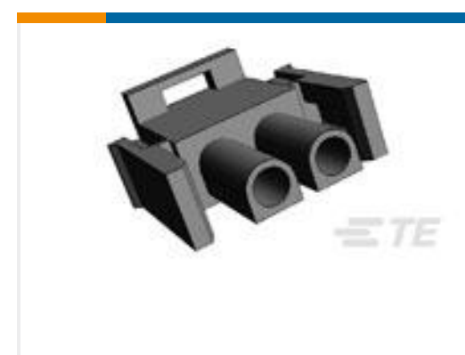
TE 产品编号1-480698-0 02P UMNL PLUG HSG NATL