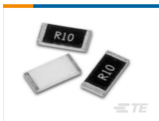
TE 产品编号2-2176058-6 厚膜电阻器：电流感应