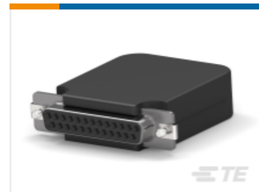
TE 产品编号1658649-1 D-Sub Crimp Recpt Signal 25 Posn, Socket Size 20, Shell Size 3