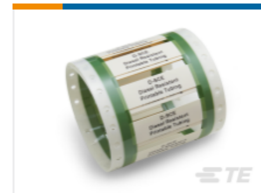
TE 产品编号1056030001 D-SCE 耐流体性套管