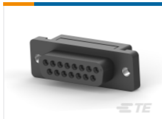
TE 产品编号1658610-1 IDC D-Sub: Receptacle Assembly, Low Profile, Signal, 2.77 mm