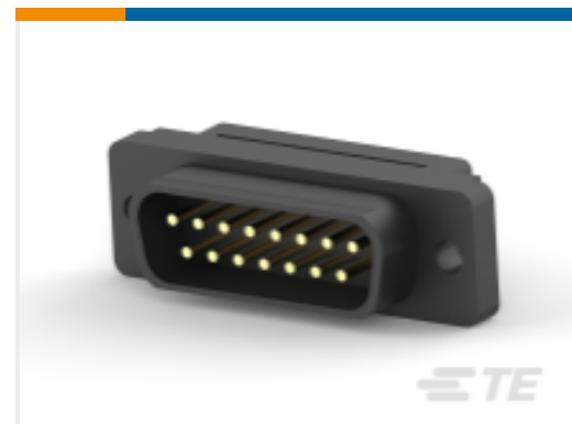
TE 产品编号1658608-3 IDC D-Sub: Plug Assembly, Low Profile, Signal, 2.77 mm