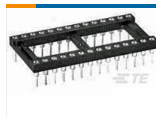
TE 产品编号1571586-2 808-AG12D-LF=800 DIP,PCB,SN/SN