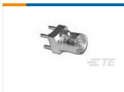
TE 产品编号1274571-1 JACK, VERTICAL, PCB, MINI BNC