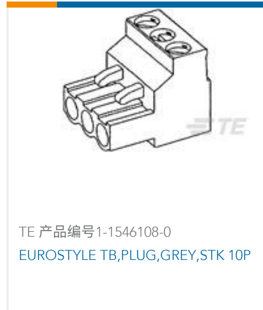
TE 产品编号1-1546108-0 EUROSTYLE TB,PLUG,GREY,STK 10P