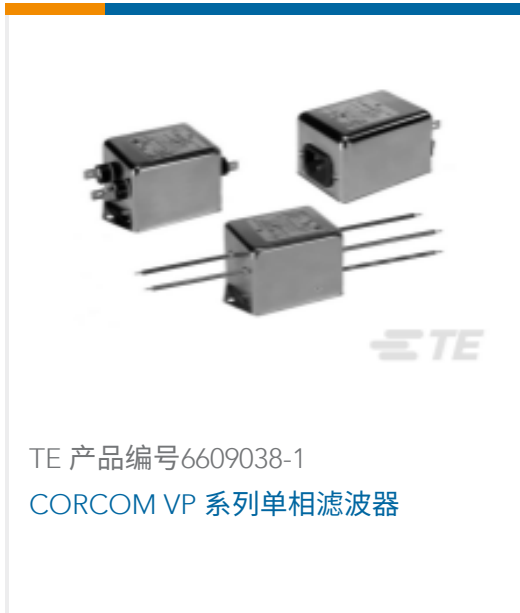
TE 产品编号6609038-1 CORCOM VP 系列单相滤波器