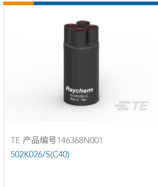
TE 产品编号146368N001 502K026/S(C40)