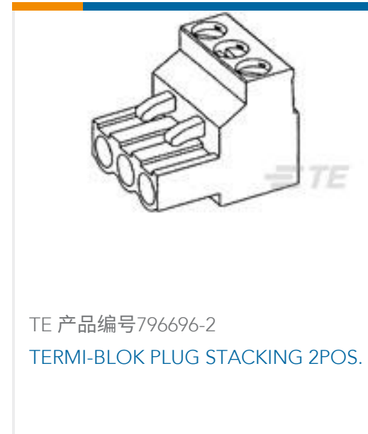
TE 产品编号796696-2 TERMI-BLOK PLUG STACKING 2POS.