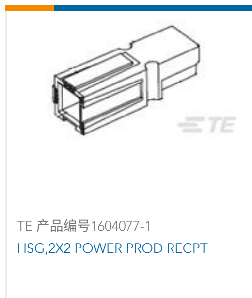
TE 产品编号1604077-1 HSG,2X2 POWER PROD RECPT