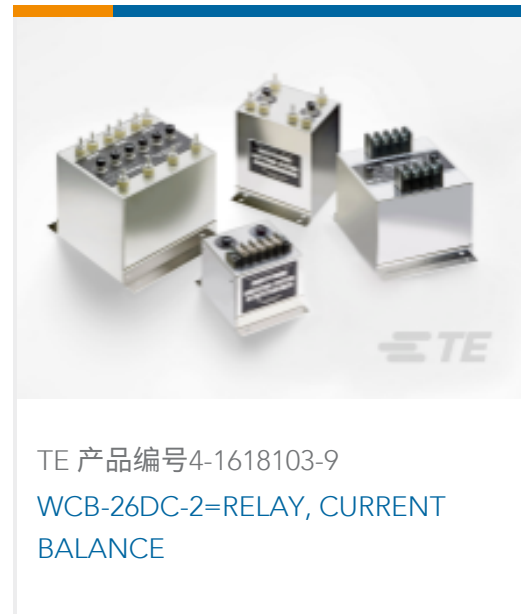
TE 产品编号4-1618103-9 WCB-26DC-2=RELAY, CURRENT BALANCE