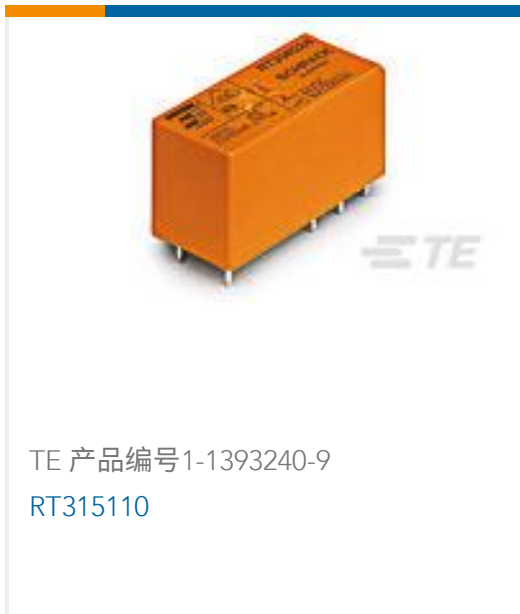
TE 产品编号1-1393240-9 RT315110