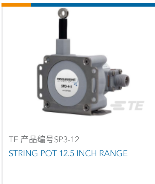
TE 产品编号SP3-12 STRING POT 12.5 INCH RANGE