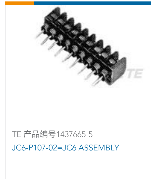
TE 产品编号1437665-5 JC6-P107-02=JC6 ASSEMBLY