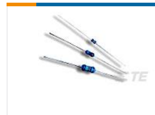
TE 产品编号2-1879026-6 YR1 0.1% 17R8