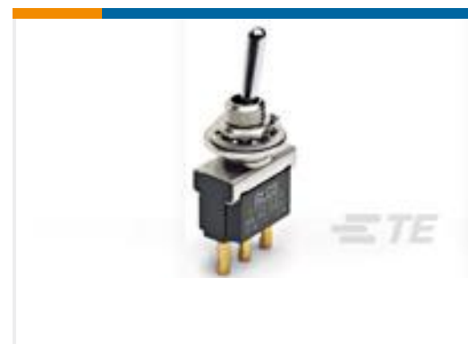
TE 产品编号5-6437630-4 FTD79G04=FLAT TOGGLE