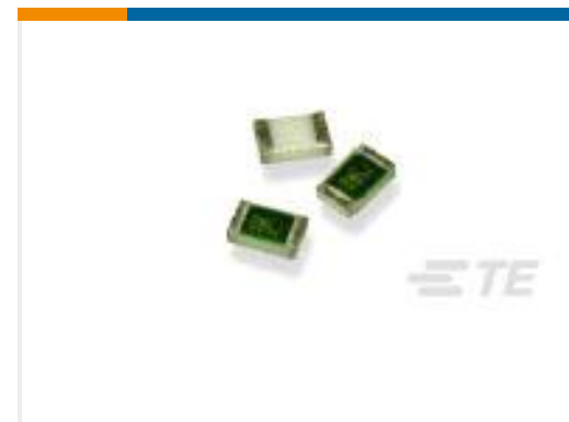
TE 产品编号1-1879222-7 CPF 0603 28R 0.1% 25PPM 1K RL