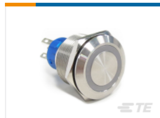
TE 产品编号6-2213772-7 AV22 DPL 5A MOVE RING LED RED 24V