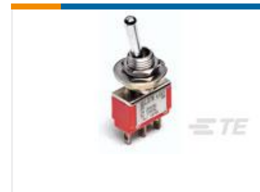
TE 产品编号1825139-8 A203SYCB04