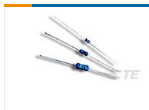
TE 产品编号1676914-6 YR1 0.1% 36K5