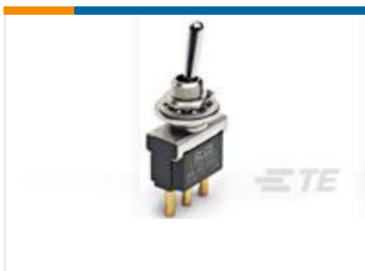
TE 产品编号5-6437630-2 FTN7904=FLAT TOGGLE