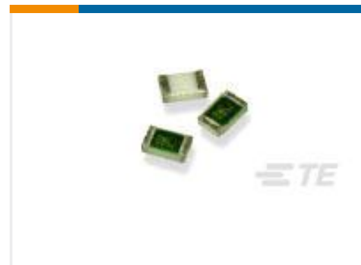
TE 产品编号9-1879221-7 CPF 0603 16R9 0.1% 25PPM 1K RL