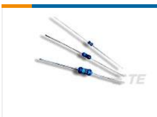
TE 产品编号3-1879026-4 YR1 0.1% 21R