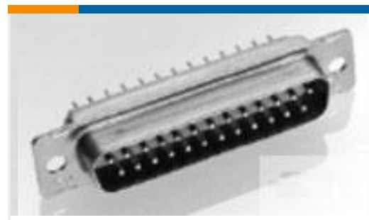
TE 产品编号204521-2 AMPLIMITE,ASY,PLUG,STD,90,5