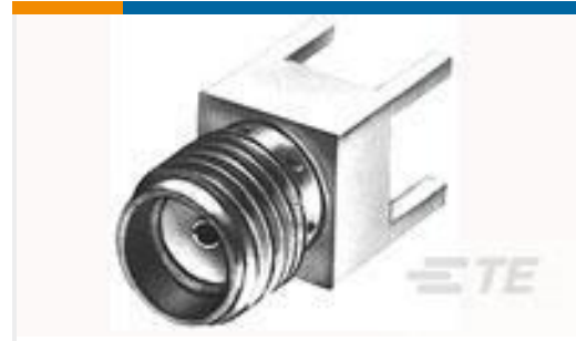
TE 产品编号1053372-1 2062 8001 90,OSM JACK, QPL