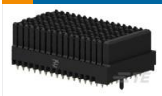
TE 产品编号1410142-1 MULTIGIG RT T2 .8" BP FULL RGH