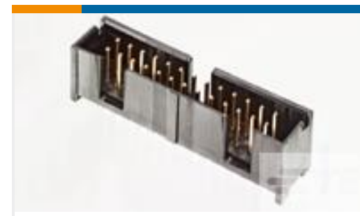
TE 产品编号103309-1 010 LOPRO HDR SP 30DP