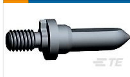
TE 产品编号2000676-3 Keyed Guide Pin, Machined, Vita 46