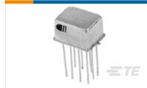
TE 产品编号1617110-6 JMGAT-5LW = M28776/6-007L