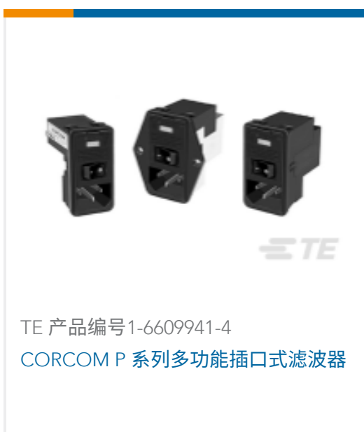
TE 产品编号1-6609941-4 CORCOM P 系列多功能插口式滤波器