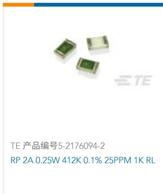
TE 产品编号5-2176094-2 RP 2A 0.25W 412K 0.1% 25PPM 1K RL