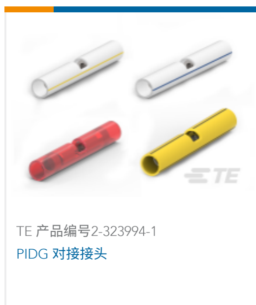
TE 产品编号2-323994-1 PIDG 对接接头