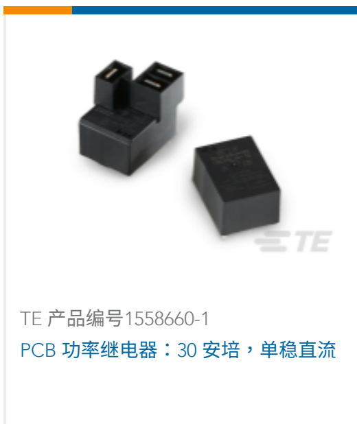
TE 产品编号1558660-1 PCB 功率继电器: 30 安培, 单稳直流