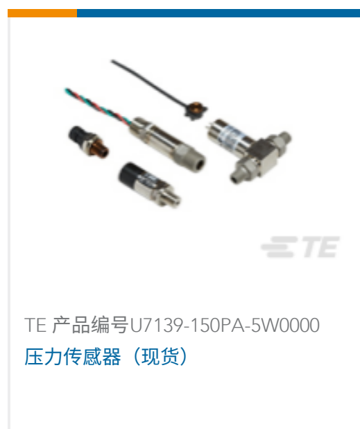
TE 产品编号U7139-150PA-5W0000 压力传感器 (现货)