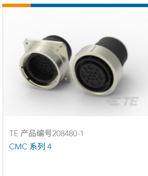
TE 产品编号208480-1 CMC 系列 4