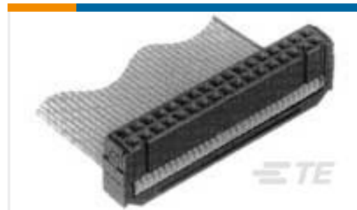
TE 产品编号1658623-7 30 NOVO MIL 30DP, LEAD FREE