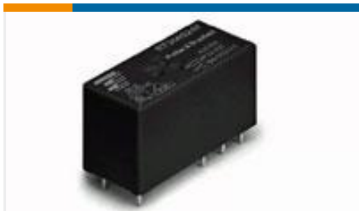
TE 产品编号2-1419108-5 RTB14012F