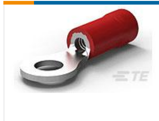
TE 产品编号34146 PG R 22-16 COMM 22-18 MIL 10