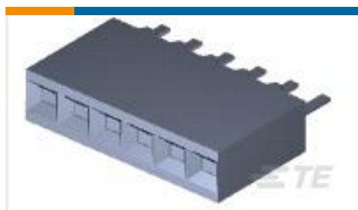
TE 产品编号5-534237-4 06 MODII VRT SR CE 100/115