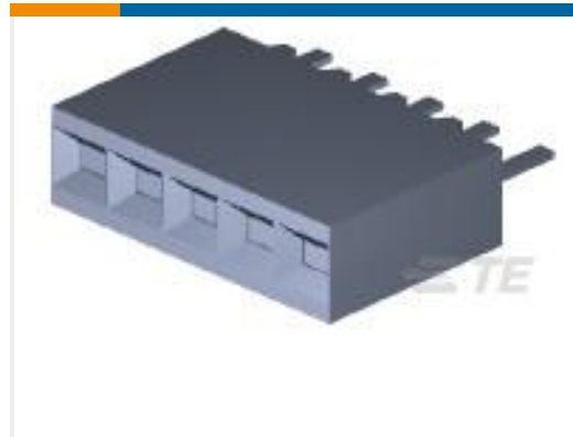
TE 产品编号5-534237-3 05 MODII VRT SR CE 100/115