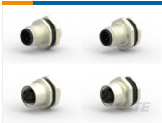
TE 产品编号T4132012031-000 M12 面板安装焊杯