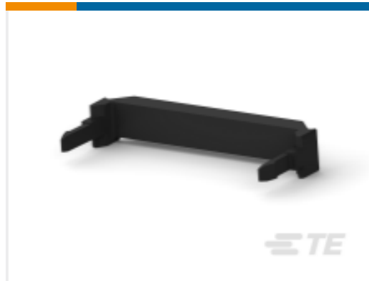
TE 产品编号1-499252-2 总线连接器：应力消除，ATA