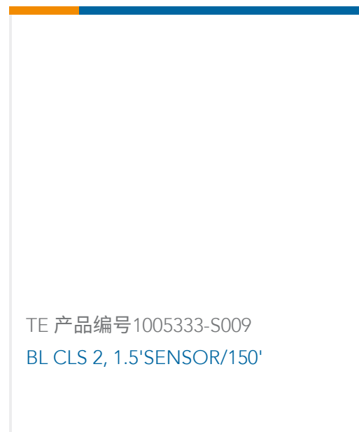
TE 产品编号1005333-S009 BL CLS 2, 1.5'SENSOR/150'