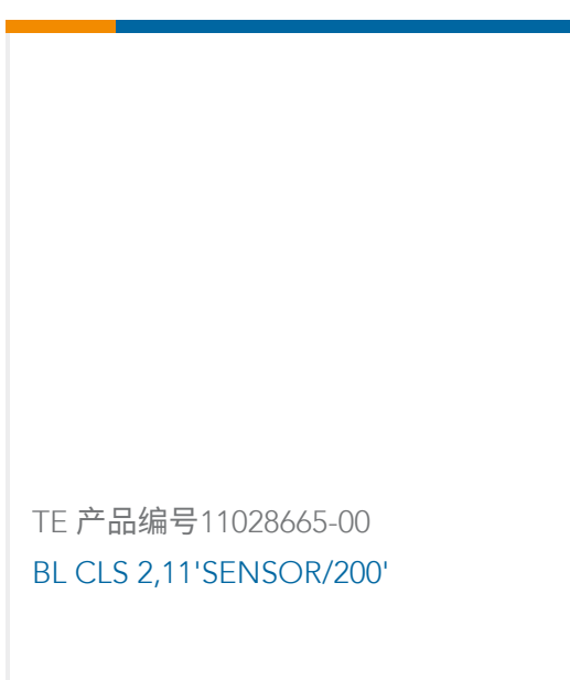
TE 产品编号11028665-00 BL CLS 2,11'SENSOR/200'