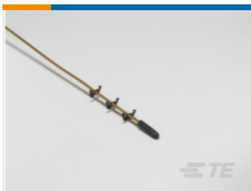
TE 产品编号11026278-00 压电流量传感器