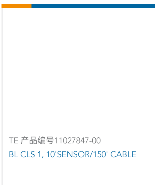
TE 产品编号11027847-00 BL CLS 1, 10'SENSOR/150' CABLE