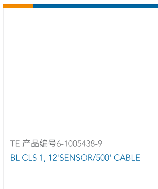
TE 产品编号6-1005438-9 BL CLS 1, 12'SENSOR/500' CABLE