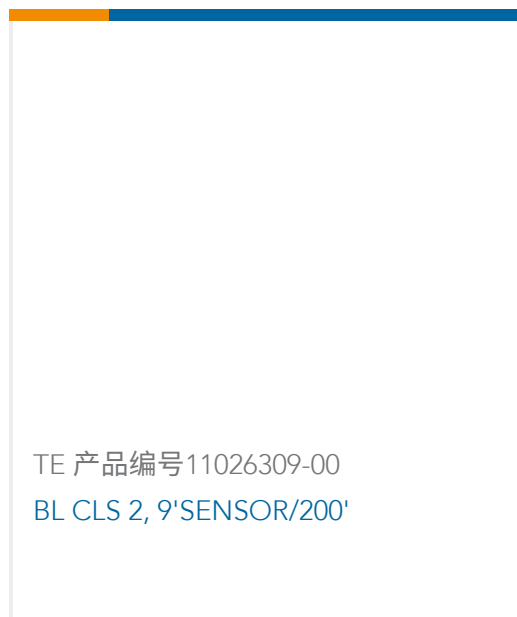
TE 产品编号11026309-00 BL CLS 2, 9'SENSOR/200'