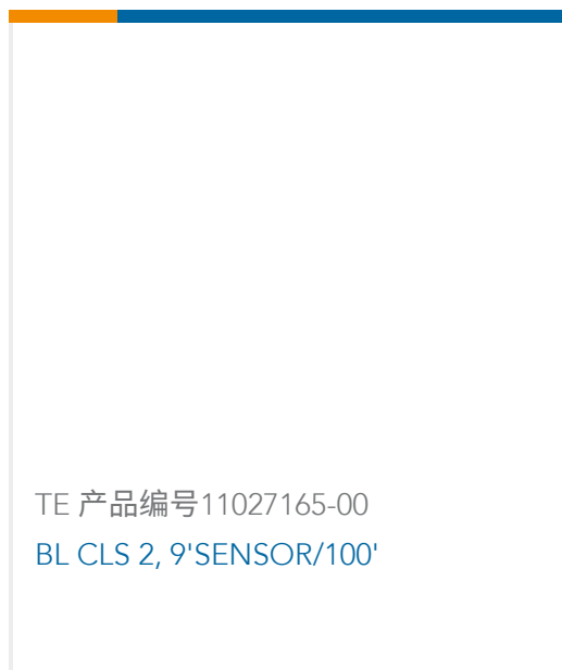
TE 产品编号11027165-00 BL CLS 2, 9'SENSOR/100'