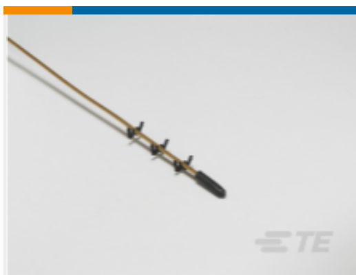
TE 产品编号11028376-00 压电流量传感器