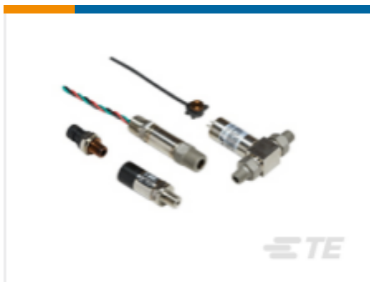
TE 产品编号10202027-00 压力传感器 (现货)