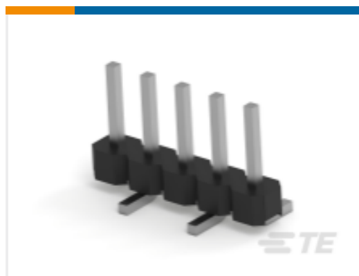
TE 产品编号2842102-4 4P,2MM,BRK HDR,SRVT,SMD,0.1AU, TR W/CAP