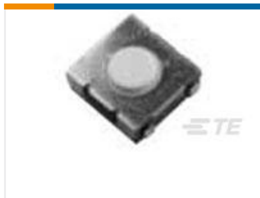
TE 产品编号1571626-6 TACT,SMT,GULL WING,160GF,T&R