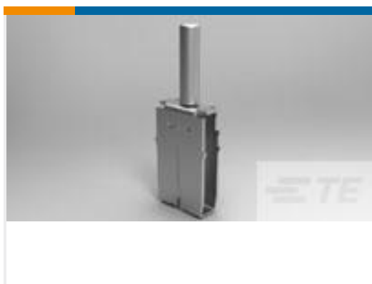
TE 产品编号1394403-1 MAG MATE ST-KONT