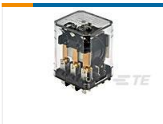
TE 产品编号8-1393118-3 KUP93-14A51-120=KU