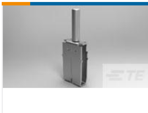
TE 产品编号1394475-1 MAG MATE ST-KONT2,0