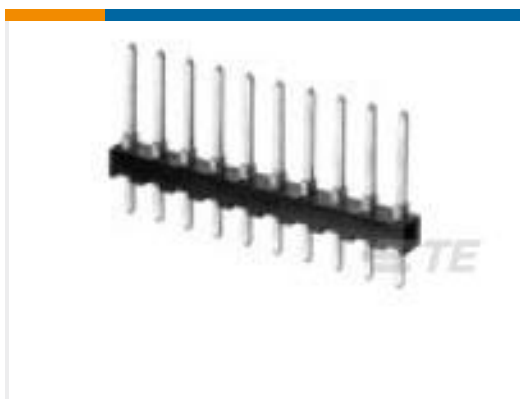
TE 产品编号1-825440-7 MOD 2 PINHDR 2X17P.