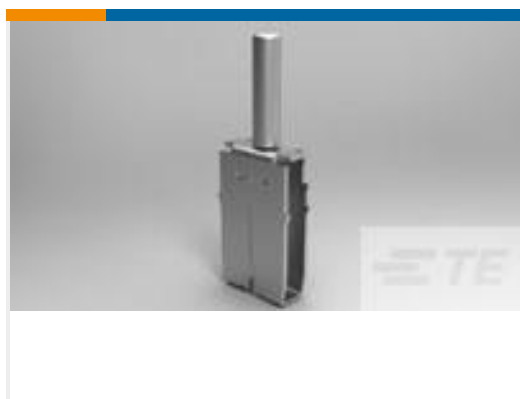
TE 产品编号1394476-1 MAG MATE ST-KONT2,0