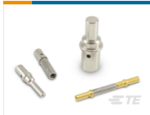
TE 产品编号0462-209-16141 DEUTSCH 实芯端子