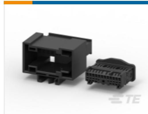
TE 产品编号1-967640-1 MQS, 连接器壳体