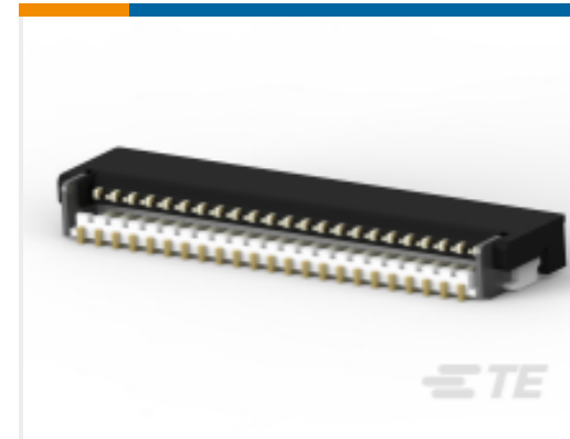
TE 产品编号2-2040832-1 .25mm FPC 连接器