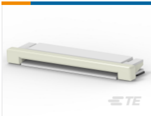
TE 产品编号1-1775333-8 .5mm FPC 连接器