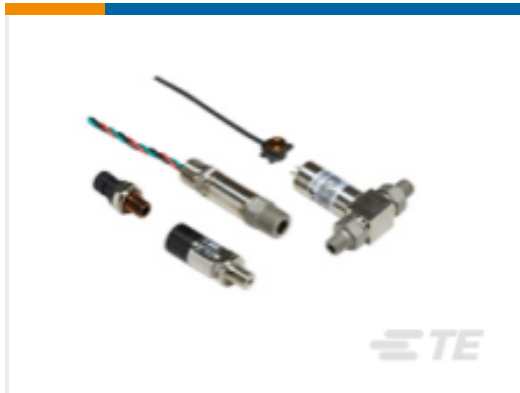
TE 产品编号10201889-00 压力传感器 (现货)