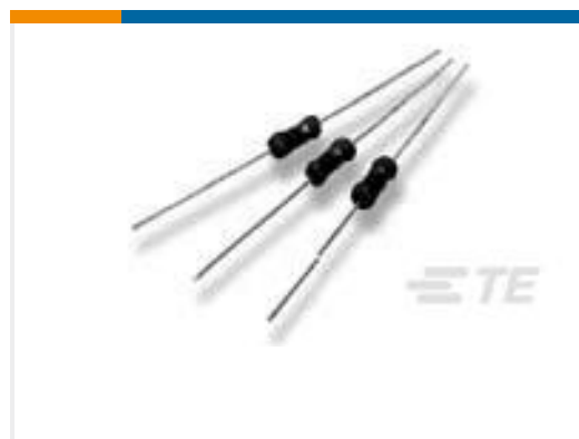
TE 产品编号1-1625893-4 5W SM M/OX 2% 27R