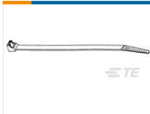
TE 产品编号1-608692-0 CABLE TIE,RELEASABLE,BLK,100PK