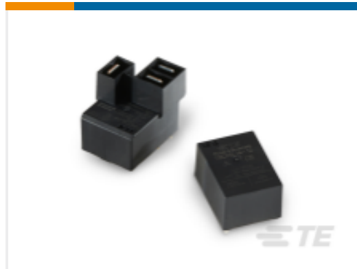
TE 产品编号1558676-1 PCB 功率继电器：30 安培，单稳直流