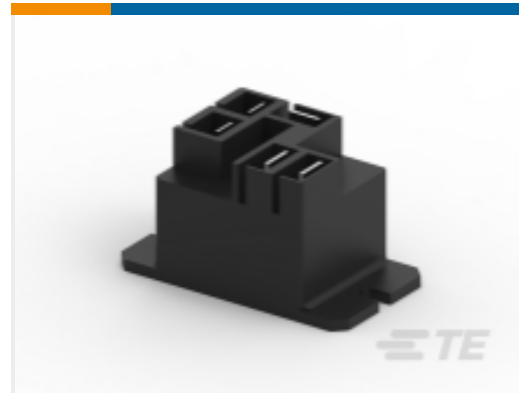
TE 产品编号1-1649341-9 T9CP5A54-120