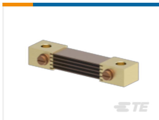
TE 产品编号CK0345-000 CI-FH5050