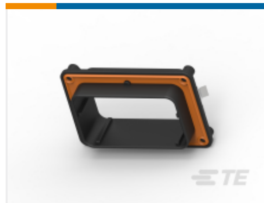
TE 产品编号YDRBM-3A0000000000 DEUTSCH DRB 安装附件