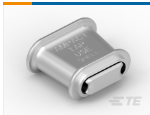
TE 产品编号2182246-3 AMPACT AL TAP SPECIAL 2-2, 4 CU, 6