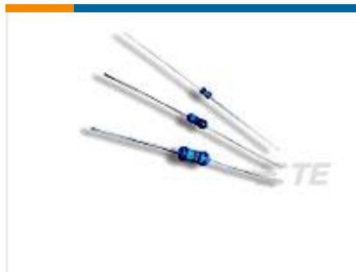
TE 产品编号1622500-1 LR1 1% 4K7