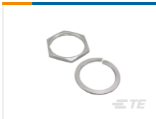
TE 产品编号114021-ZZ DEUTSCH HD30 安装硬件