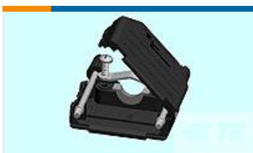
TE 产品编号1-1991253-5 15 WAY LOW COST D SUB BACKSHEL