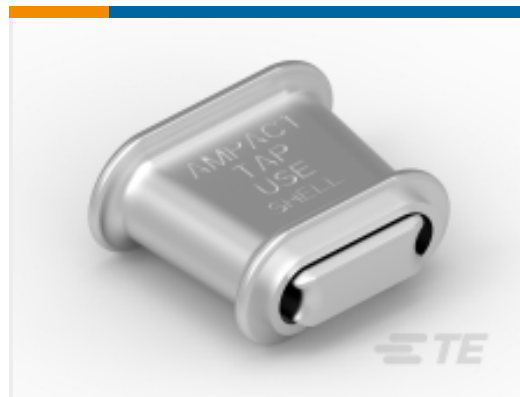
TE 产品编号2182246-1 AMPACT Al Tap Special 4-6 sol, 4 sol