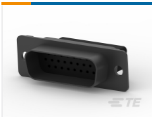
TE 产品编号1658671-1 D-Sub Crimp: Plug, Signal, 26 Posn, Pin Size 22, Shell Size 2