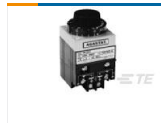
TE 产品编号1423157-3 7012ABL=RLY,STD,ON,2P,120VAC,15SEC,X OP