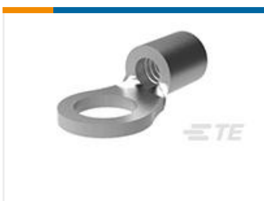
TE 产品编号8-322454-2 TERMINAL,SOLIS R 12-10 8