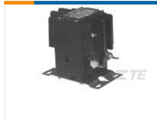
TE 产品编号6-1393132-1 P40C42D12C1-120=CONTACTORS