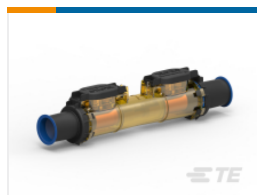
TE 产品编号CR5859-000 SL-750-120V-F-01(B1)