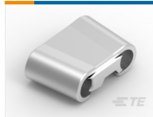
TE 产品编号1443209-1 CONNECTOR, 1351 KCMIL-636