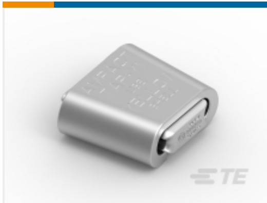
TE 产品编号83861-1 AMPACT TAP 1431 AAC-1272 ACSR