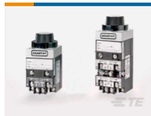
TE 产品编号7-1423162-5 7022ACX=RLY,STD,OFF,2P,120VAC,15SEC,X OP