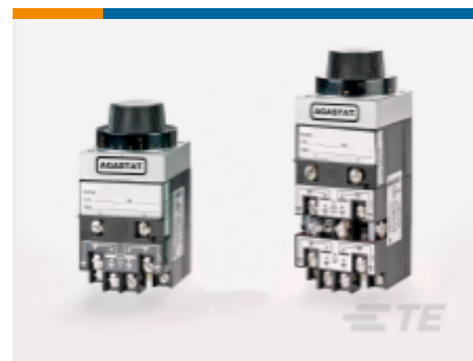
TE 产品编号6-1423157-2 7012ADT=RLY,STD,ON,2P,120AC,5