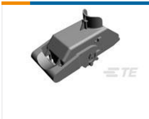
TE 产品编号1452862-1 COVER 96POS. ASSY