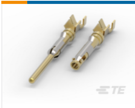
TE 产品编号164163-2 欧洲、中东和非洲类型 III 端子低型面