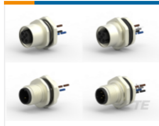
TE 产品编号T4171120008-001 M12 面板安装导线