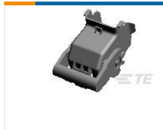
TE 产品编号1452416-1 58POS CONNECTOR COVER 180 ASSY