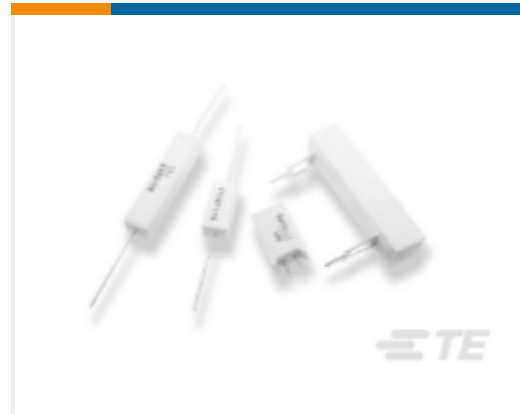
TE 产品编号1-1623793-6 线绕电阻器：水平安装