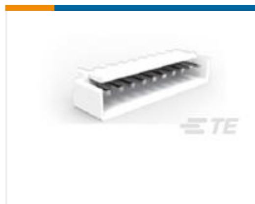
TE 产品编号1744427-2 EP Header Asy, Shrouded, 2 Pos, GW