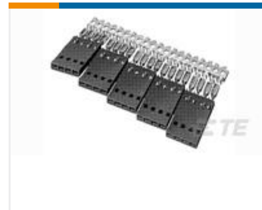
TE 产品编号103972-2 8X3 MTE RCPT SR RIBBED .100CL