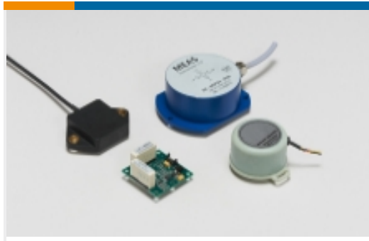
倾角传感器和倾角仪(6)