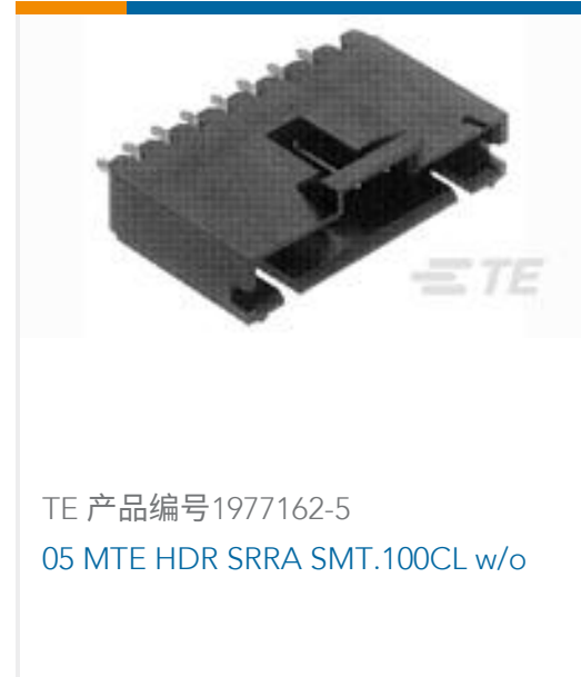
TE 产品编号1977162-5 05 MTE HDR SRRA SMT.100CL w/o