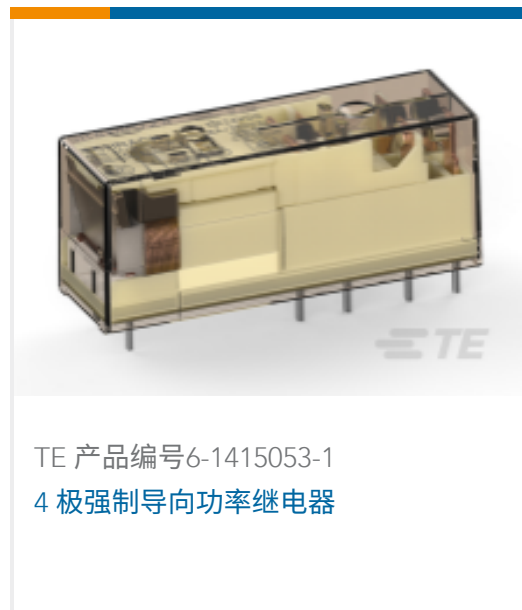
TE 产品编号6-1415053-1 4 极强制导向功率继电器