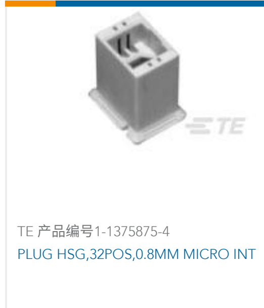
TE 产品编号1-1375875-4 PLUG HSG,32POS,0.8MM MICRO INT