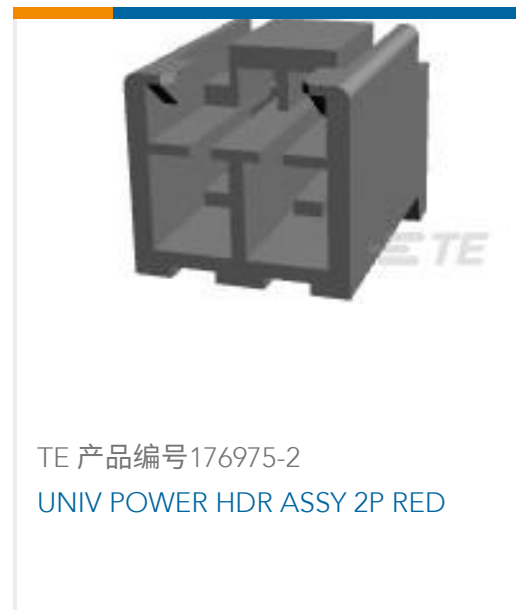
TE 产品编号176975-2 UNIV POWER HDR ASSY 2P RED