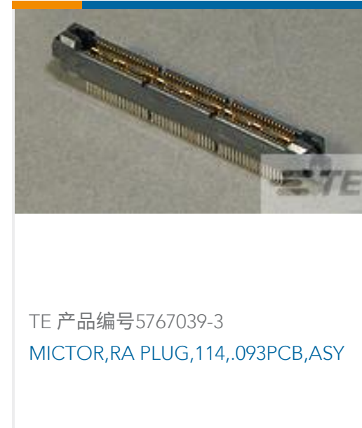
TE 产品编号5767039-3 MICTOR,RA PLUG,114,.093PCB,ASY