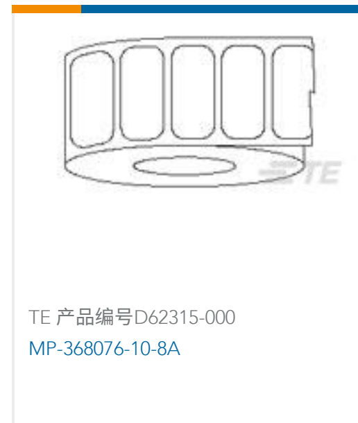
TE 产品编号D62315-000 MP-368076-10-8A