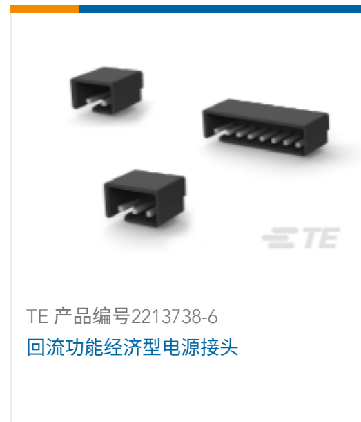
TE 产品编号2213738-6 回流功能经济型电源接头