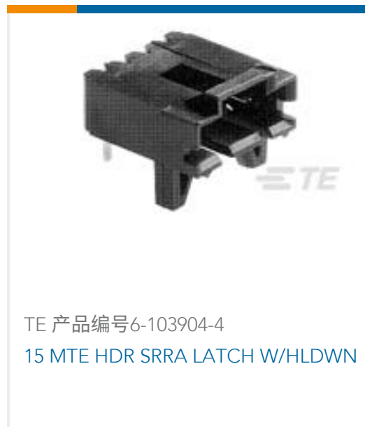
TE 产品编号6-103904-4 15 MTE HDR SRRA LATCH W/HLDWN