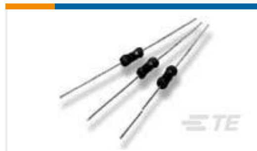
TE 产品编号4-1879352-8 RR02 5% 30R AMMO