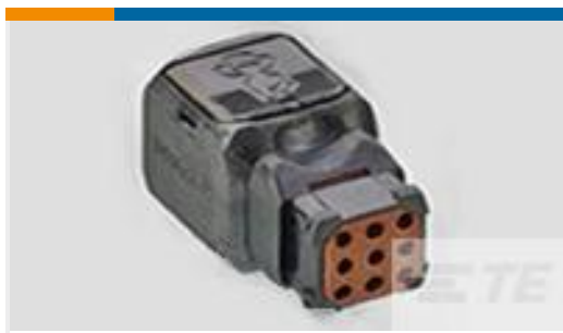
TE 产品编号D369-R99-CS0 369 9 WAY REC, NO CONTACTS, SKT