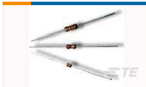
TE 产品编号8-1623931-4 CFR25 5% 8R2