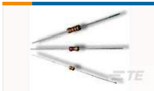
TE 产品编号2-1623931-9 CFR25 5% 3R9