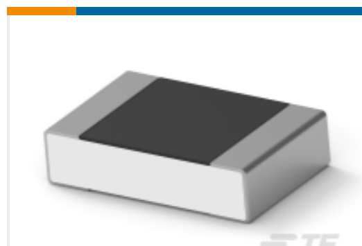
TE 产品编号2-2176373-6 RQ 0805 18R2 0.1% 10PPM 1K RL