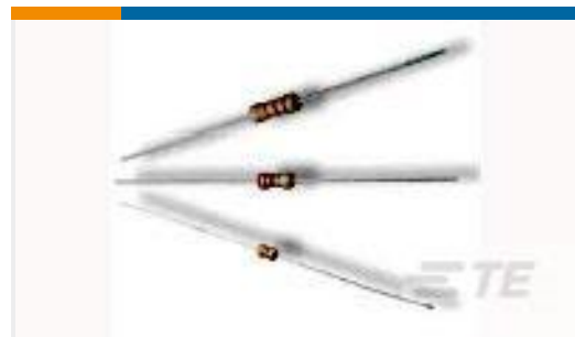
TE 产品编号1-1623931-9 CFR25 5% 39R