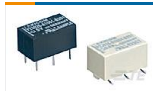
TE 产品编号2-1393774-0 V23026C1051B201