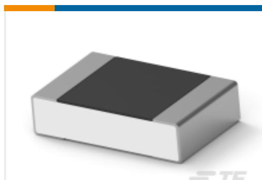
TE 产品编号4-2176373-1 RQ 0805 26R1 0.1% 10PPM 1K RL