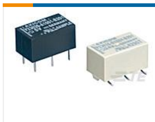
TE 产品编号1-1393774-7 V23026A1006B201