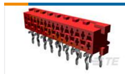
TE 产品编号8-215460-6 MICRO-MATCH FSID P