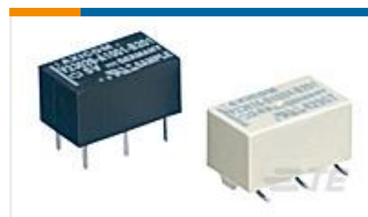
TE 产品编号1-1393774-7 V23026A1006B201