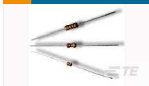
TE 产品编号1-1623931-9 CFR25 5% 39R