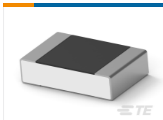
TE 产品编号2-2176373-6 RQ 0805 18R2 0.1% 10PPM 1K RL