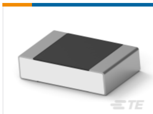
TE 产品编号4-2176373-1 RQ 0805 26R1 0.1% 10PPM 1K RL