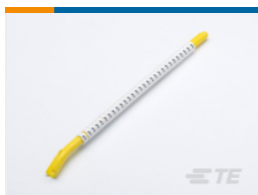
TE 产品编号 CAT-T3437-ST2999 STD 搭锁式标志