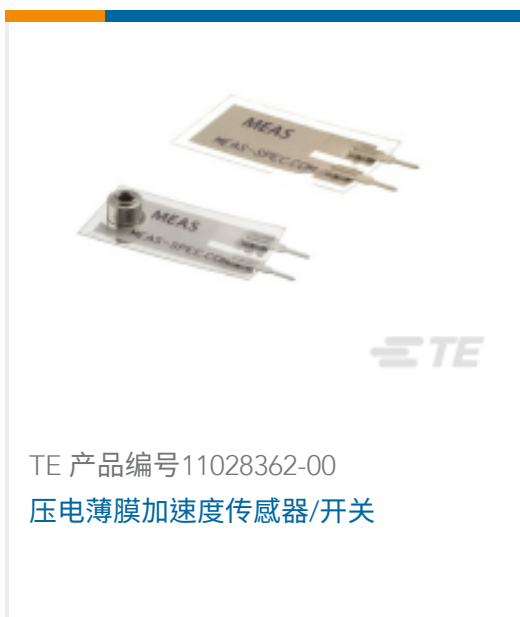
TE 产品编号11028362-00 压电薄膜加速度传感器/开关