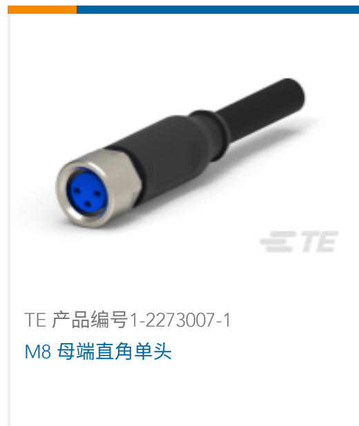
TE 产品编号1-2273007-1 M8 母端直角单头