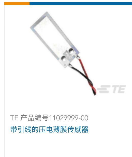
TE 产品编号11029999-00 带引线的压电薄膜传感器