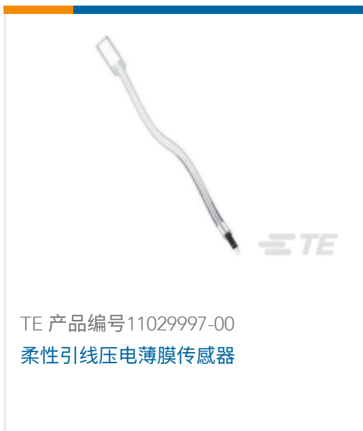
TE 产品编号11029997-00 柔性引线压电薄膜传感器