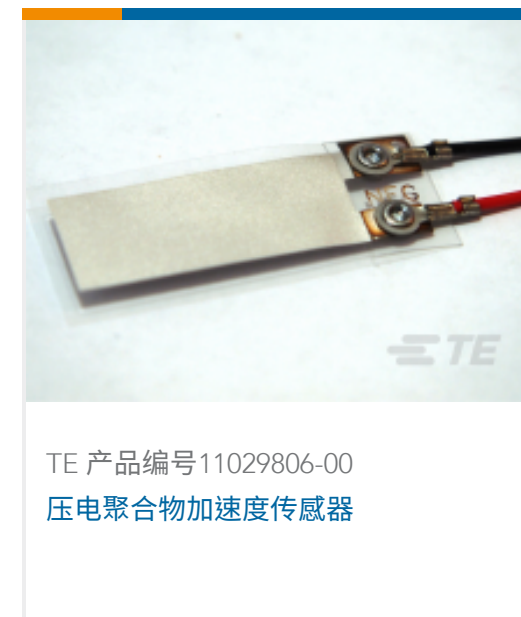
TE 产品编号11029806-00 压电聚合物加速度传感器