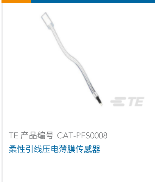
TE 产品编号 CAT-PFS0008 柔性引线压电薄膜传感器