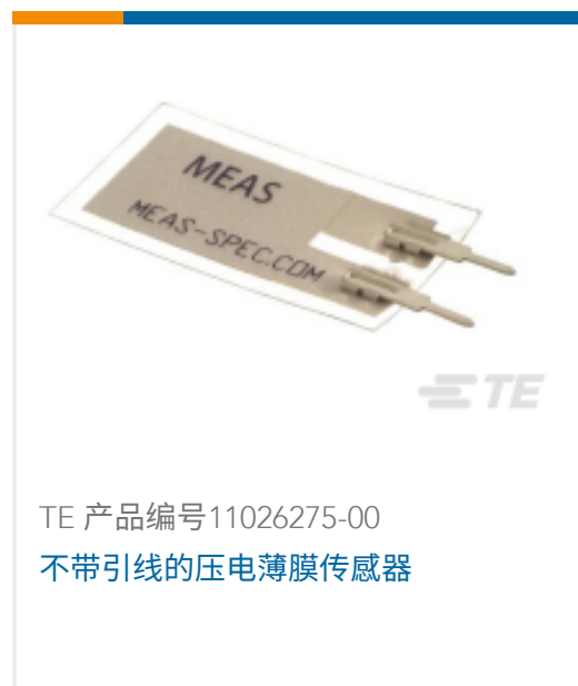
TE 产品编号11026275-00 不带引线的压电薄膜传感器