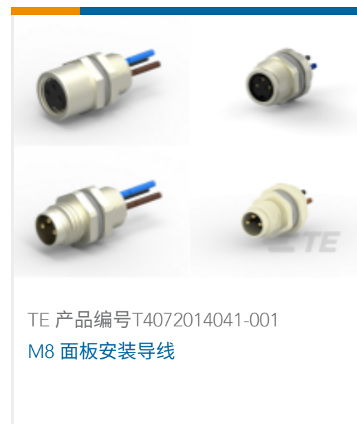
TE 产品编号T4072014041-001 M8 面板安装导线