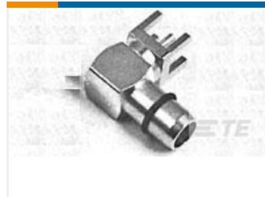
TE 产品编号1059691-1 4565 0000 00