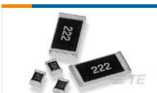
TE 产品编号1623160-1 CRG0805 1% 240K