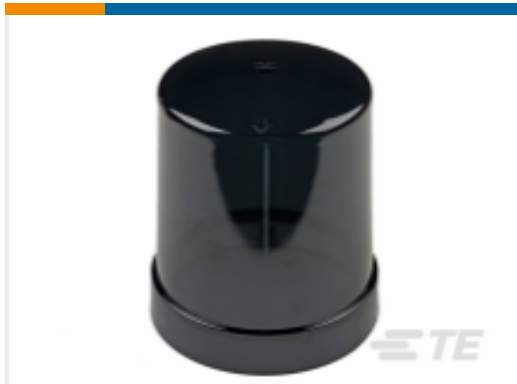
TE 产品编号1-2306129-1 光控制外壳