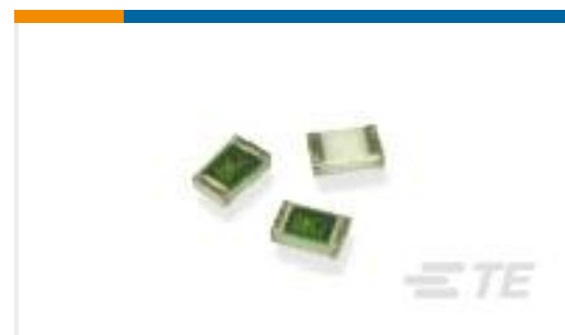
TE 产品编号1676228-2 RN 0805 1K27 0.1% 10PPM 1KRL