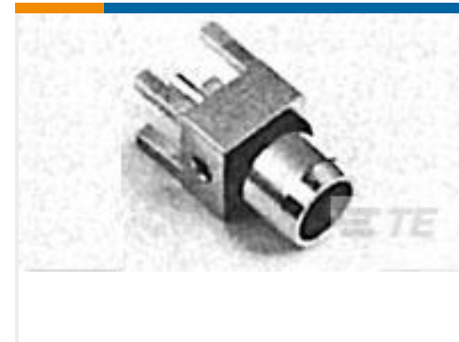
TE 产品编号1059684-1 OSP PRINTED CIRCUIT BOARD PLUG RECEPT