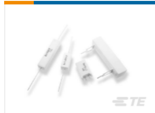
TE 产品编号1-1623793-2 线绕电阻器：水平安装