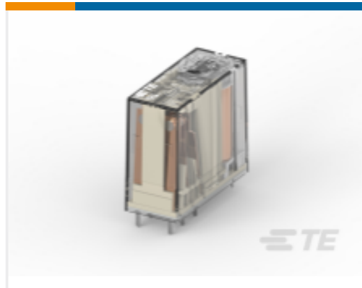
TE 产品编号1-1393258-5 2极强制导向功率继电器