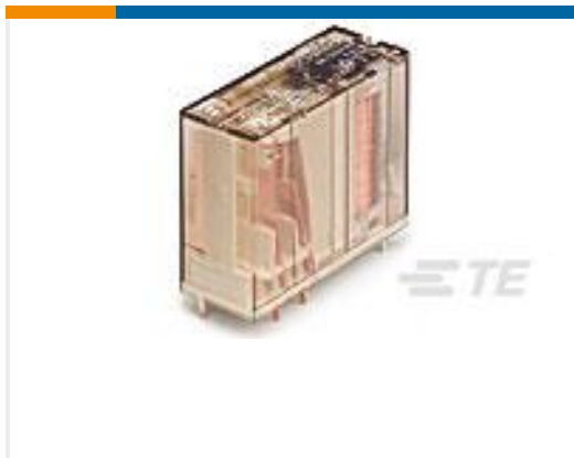
TE 产品编号1-1393258-7 V23047-A1024-A511