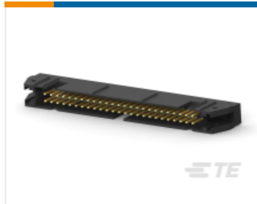
TE 产品编号1-5102159-1 AMP 锁门通用插头