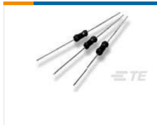
TE 产品编号1-1879355-4 RR03 5% 15K AMMO