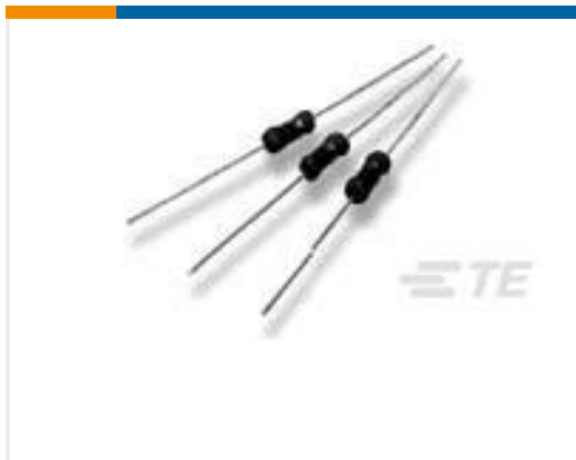
TE 产品编号1-1879354-3 RR03 5% 1R0 AMMO