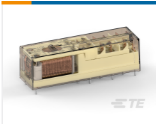
TE 产品编号1-1393260-3 增强绝缘强制导向继电器