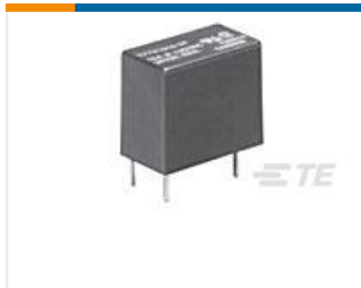
TE 产品编号1-1393194-0 T77S1D10-24