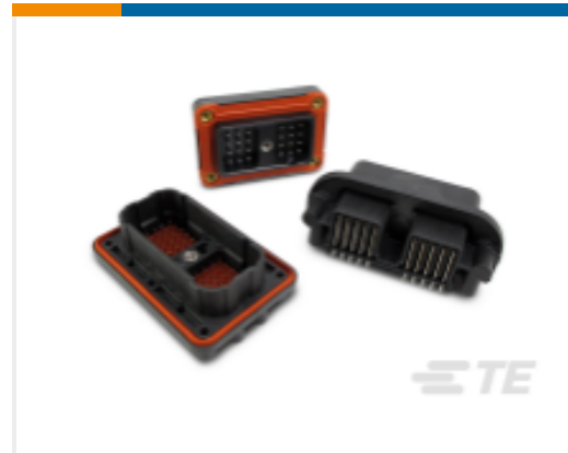
TE 产品编号DRC23-64PAA-N010 DEUTSCH DRC 接头