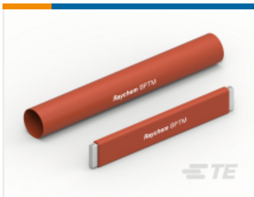
TE 产品编号412147-000 母线热缩管高达 24 kV