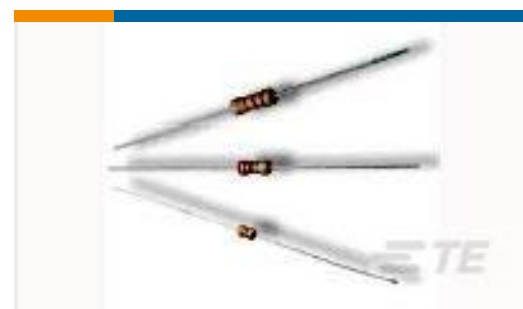
TE 产品编号5-1623933-3 CFR50 5% 680R