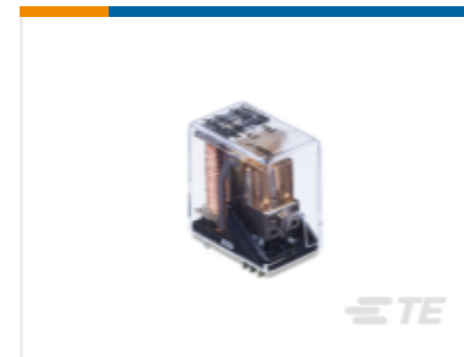
TE 产品编号7-1393806-1 信号继电器：5 安培，单稳直流