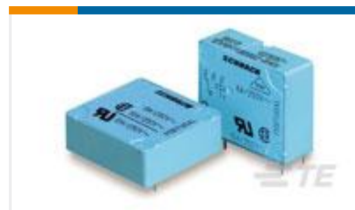
TE 产品编号2-1393215-3 V23057-A0006-A201