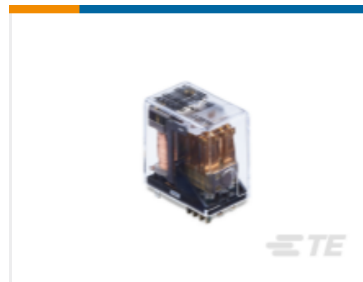
TE 产品编号3-1393817-9 CRADLE P/W 继电器 V23003