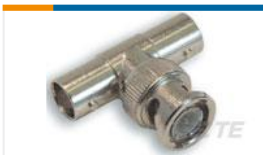
TE 产品编号5-1634532-1 BNC T Adpt JPJ 50Ohm Nickel Gold Pltd