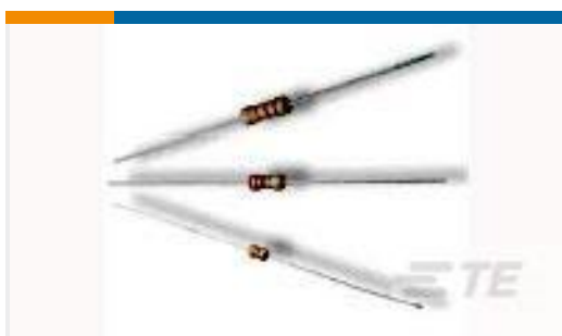
TE 产品编号2-1623931-1 CFR25 5% 3K3