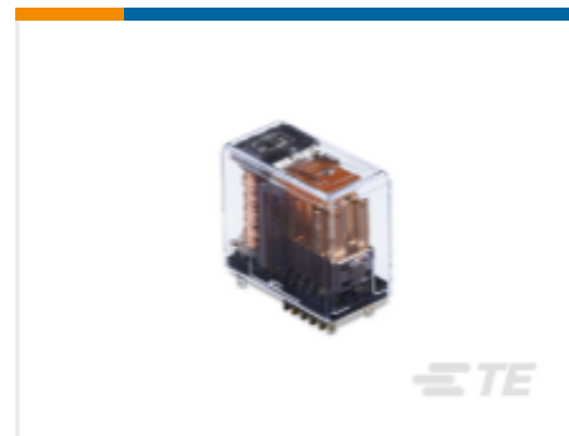
TE 产品编号3-1393813-6 CRADLE S 继电器 V23054