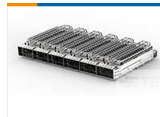
TE 产品编号2-2170708-1 CAGE ASSY, 1X6, QSFP28, SPRING, HS, LP