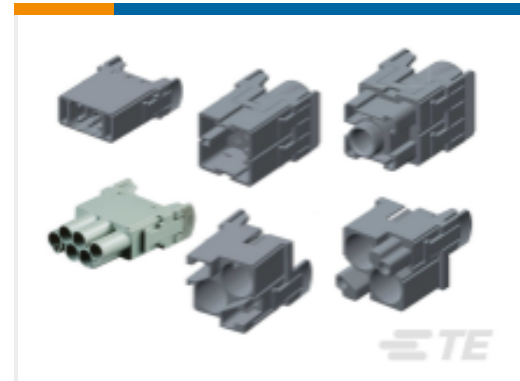
TE 产品编号T2111092201-007 HDC HMN - 符合铁路标准的模块化系统