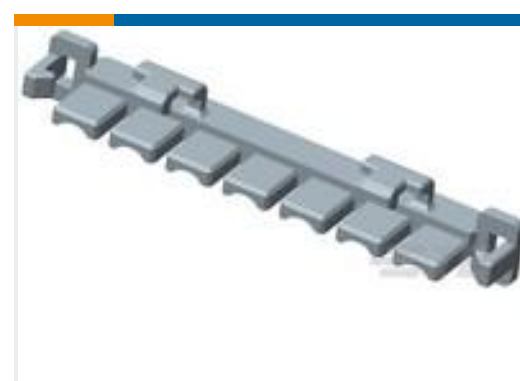
TE 产品编号1-1969609-2 12P VAL-U-LOK TPA 26-22 AWG