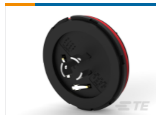
TE 产品编号1-2336396-1 ASSEMBLY, LIGHT CONTROLLER BASE, W/VENT