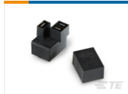
TE 产品编号1558662-4 PCB 功率继电器：30 安培，单稳直流系统