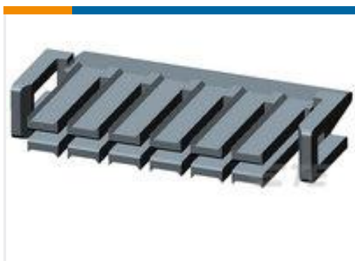
TE 产品编号2-1969541-8 RETAINER, TPA, DUAL ROW, EP2.5