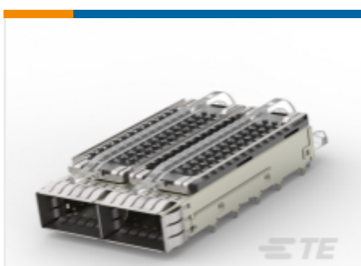
TE 产品编号2170808-1 QSFP28, 1X2, CAGE ASSY, SPRING, HS, LP