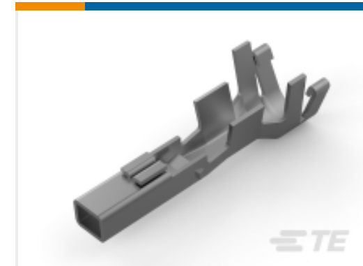
TE 产品编号177915-9 POWER DBL LOCK REC CONT