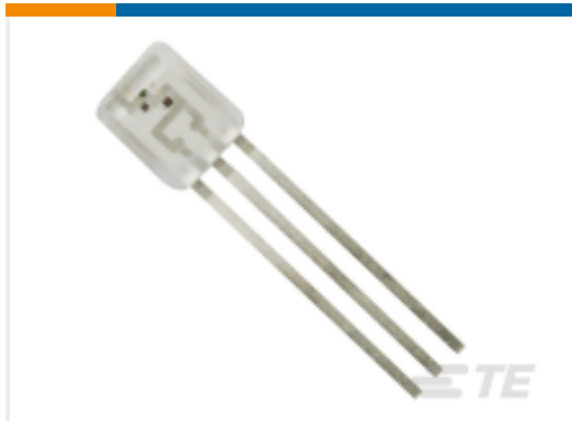
TE 产品编号11032254-00 光电发射器组件