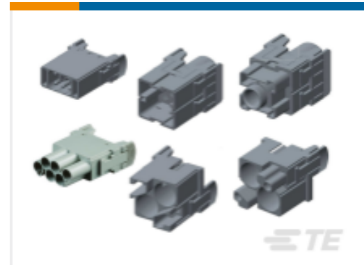
TE 产品编号T2111092201-007 HDC HMN - 符合铁路标准的模块化系统