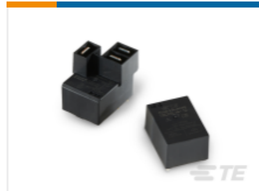
TE 产品编号1558662-4 PCB 功率继电器：30 安培，单稳直流系统