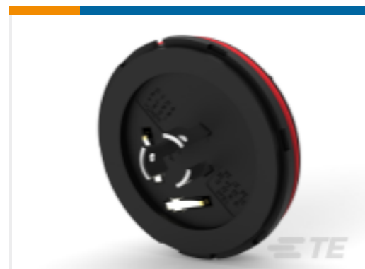
TE 产品编号1-2336396-1 ASSEMBLY, LIGHT CONTROLLER BASE, W/VENT