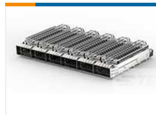
TE 产品编号2-2170708-1 CAGE ASSY, 1X6, QSFP28, SPRING, HS, LP