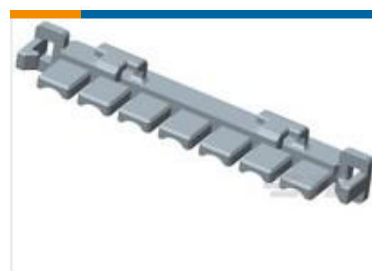
TE 产品编号1-1969609-2 12P VAL-U-LOK TPA 26-22 AWG