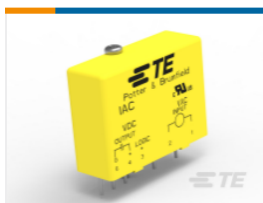
TE 产品编号 CAT-P851-IA1A P&B SSR 纤薄输入交流模块