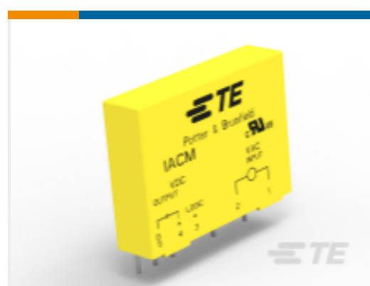
TE 产品编号 8-1393028-9 SLIM INPUT AC MOD, 24V DC LOGIC-120VAC IP