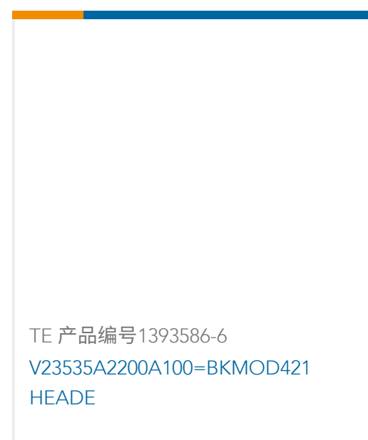
TE 产品编号1393586-6 V23535A2200A100=BKMOD421 HEADE