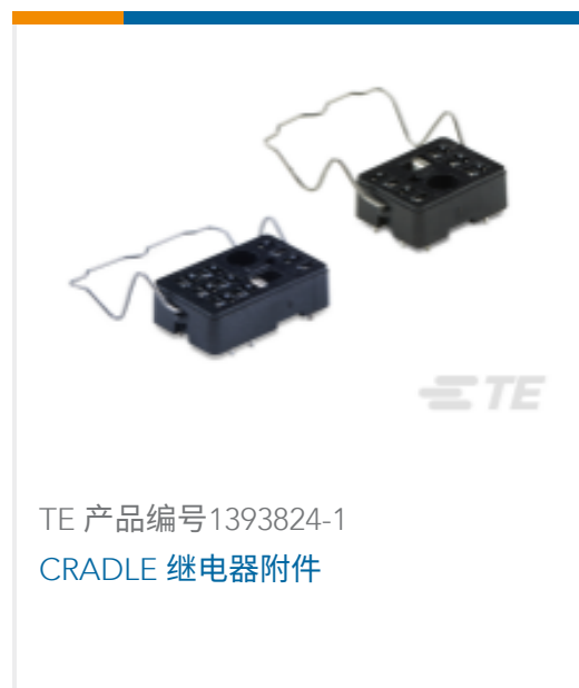
TE 产品编号1393824-1 CRADLE 继电器附件