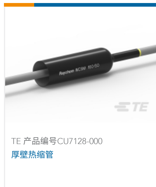
TE 产品编号CU7128-000 厚壁热缩管