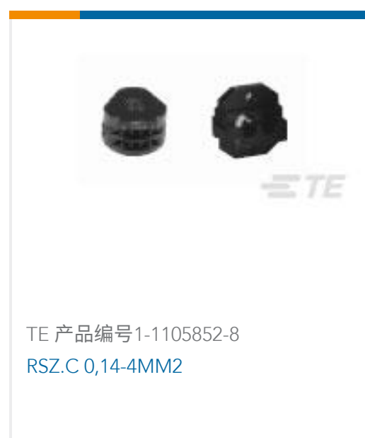
TE 产品编号1-1105852-8 RSZ.C 0,14-4MM2