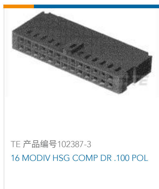
TE 产品编号102387-3 16 MODIV HSG COMP DR .100 POL