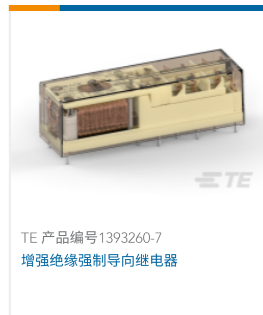
TE 产品编号1393260-7 增强绝缘强制导向继电器