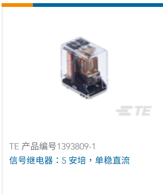
TE 产品编号1393809-1 信号继电器：5 安培，单稳直流