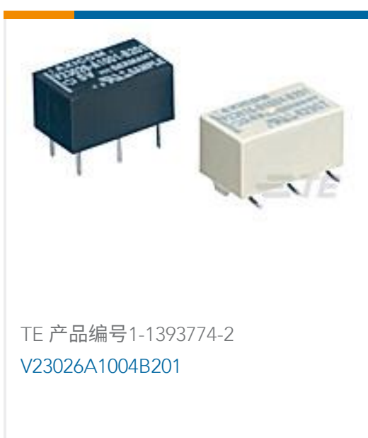
TE 产品编号1-1393774-2 V23026A1004B201