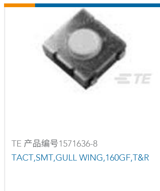
TE 产品编号1571636-8 TACT,SMT,GULL WING,160GF,T&R