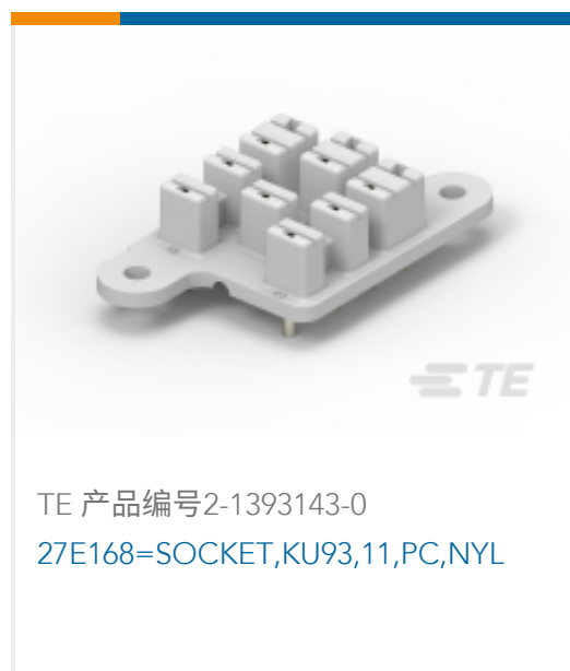
TE 产品编号2-1393143-0 27E168=SOCKET,KU93,11,PC,NYL