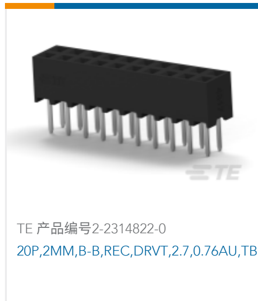
TE 产品编号2-2314822-0 20P,2MM,B-B,REC,DRVT,2.7,0.76AU,TB