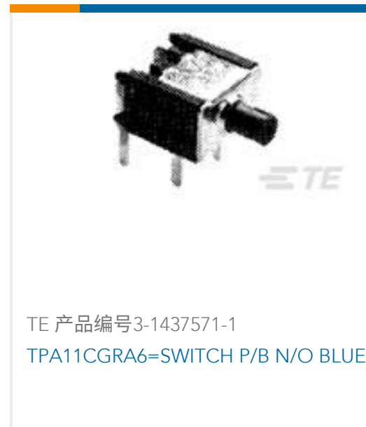
TE 产品编号3-1437571-1 TPA11CGRA6=SWITCH P/B N/O BLUE