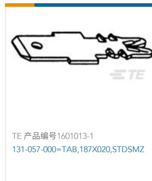
TE 产品编号1601013-1 131-057-000=TAB,187X020,STD SMZ