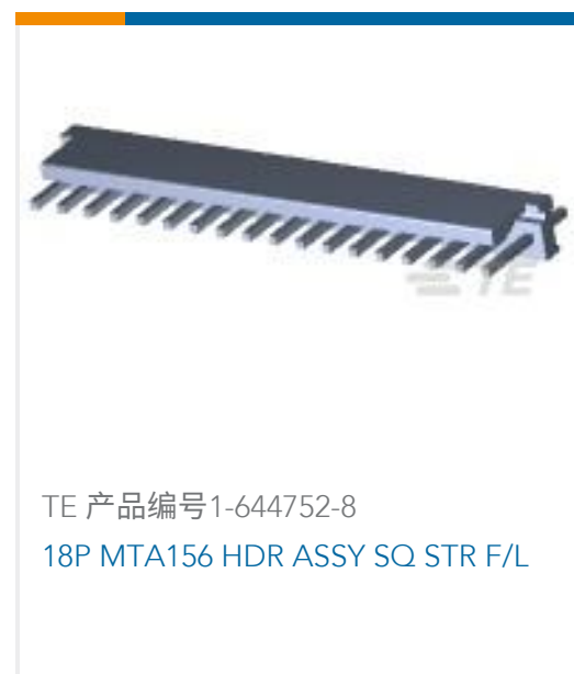
TE 产品编号1-644752-8 18P MTA156 HDR ASSY SQ STR F/L