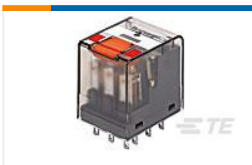
TE 产品编号2-1393154-2 PT580730