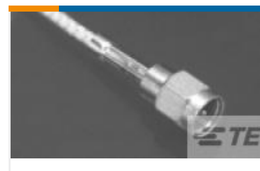
TE 产品编号1050735-1 2001 7585 02