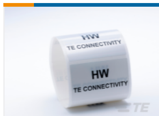
TE 产品编号D67330-000 HW 高粘性白色聚酯标签