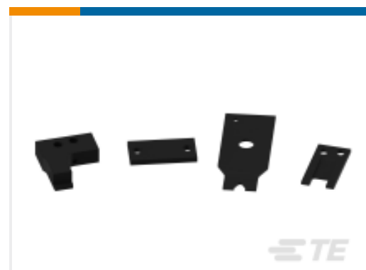
TE 产品编号463310-6 BLADE, STRIPPING #22