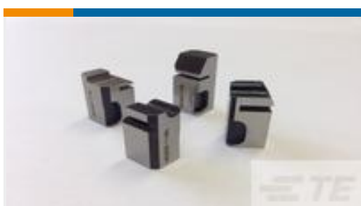
TE 产品编号462547-1 FLOATING SHEAR