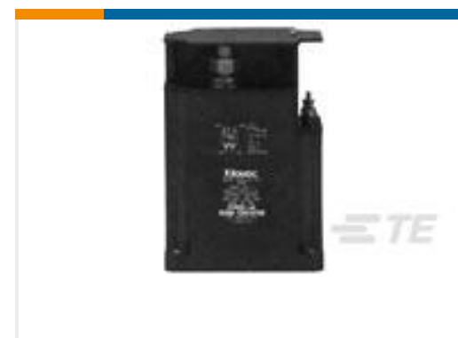
TE 产品编号4-1618002-9 EV500-5B=RELAY, PRESSURIZED, S