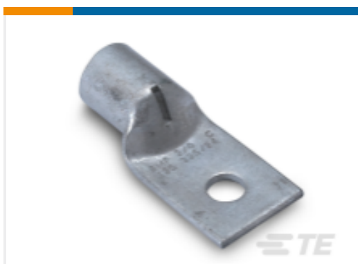
TE 产品编号325707 AMPOWER 端子 1 个螺钉孔