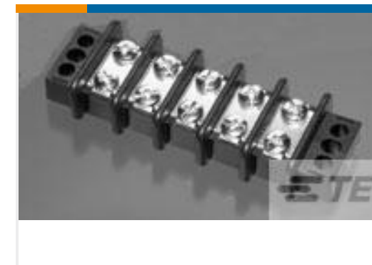
TE 产品编号1546311-5 5P .563" DR BARRIER,W/WASHER