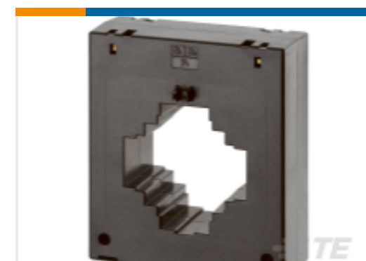
TE 产品编号EA3348-000 CI-MB5D-1600/5