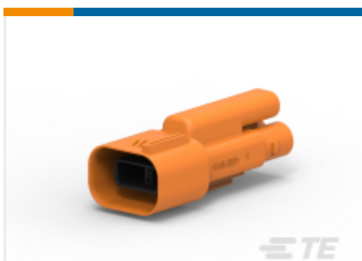
TE 产品编号2103191-6 CAP SUBASSY, KEY F, HVA280-2PHI