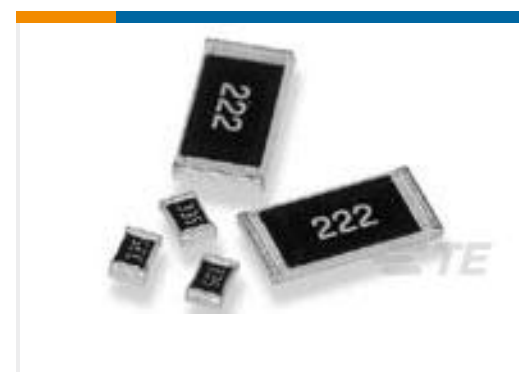
TE 产品编号1-1879500-1 CRGH2010 5% 36K 1W