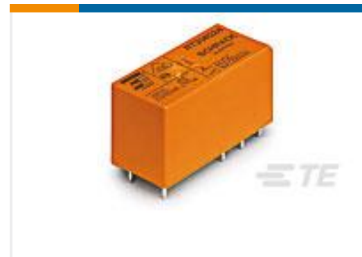
TE 产品编号4-1419136-3 RT423012