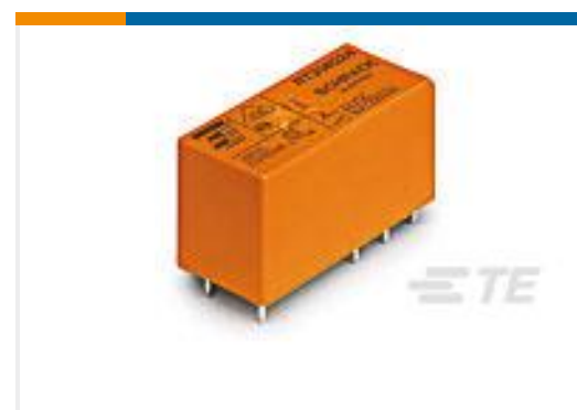
TE 产品编号3-1393240-8 RT334F05