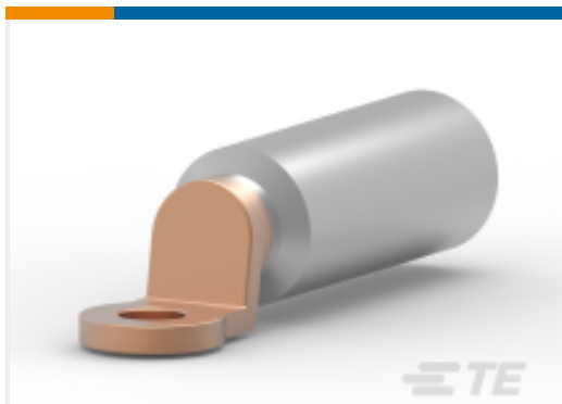
TE 产品编号1306957-1 双金属压缩电缆接头