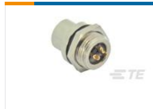
TE 产品编号1838417-2 M12 Mtl FEMALE PNL CONN. PCB Front (Hex)