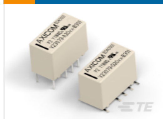
TE 产品编号 3-1393790-4 V23079A2006X105