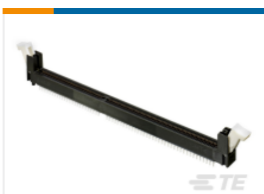
TE 产品编号4-1932000-6 DDR3 DIMM 插槽