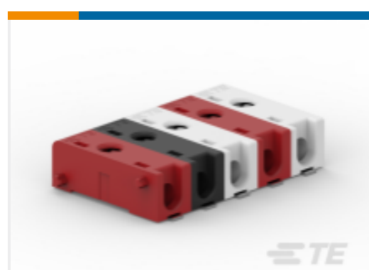
TE 产品编号2-2834006-0 BUCHANAN WIREMATE 插入式