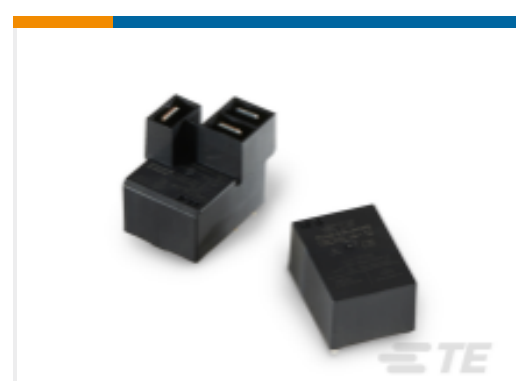
TE 产品编号1558665-4 PCB 功率继电器：30 安培，单稳直流