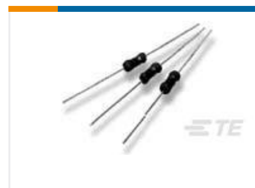
TE 产品编号4-1879350-3 RR01 5% 12R AMMO