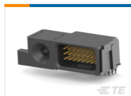
TE 产品编号2085117-1 CONN SOCKET ASSY STRAIGHT SOLDER FLATPAQ