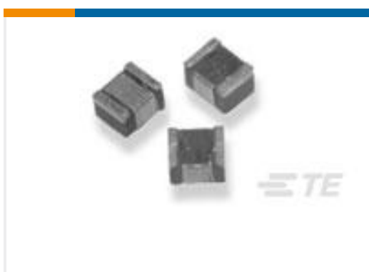
TE 产品编号3-2176086-3 3654 0402 25nH 5% 2K RL