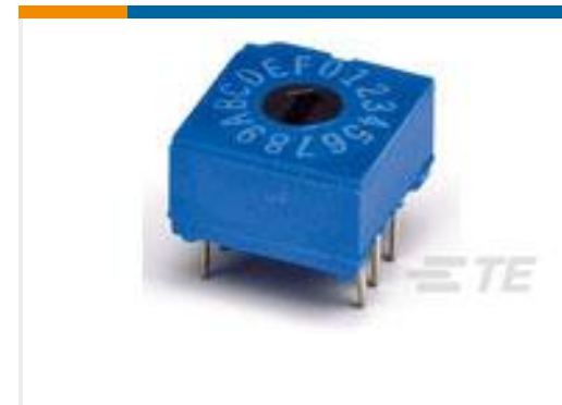
TE 产品编号1-1825007-8 DRD16SE04=ROT DIP, 16P, SMT