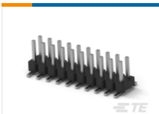
TE 产品编号1-2842144-0 20P, 2MM, BRK HDR, DRVT, SMD, 0.76 AU, TR W/CAP