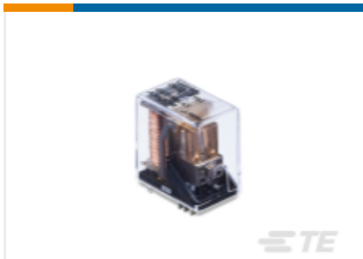
TE 产品编号1-1393811-2 信号继电器: 5 安培, 单稳直流