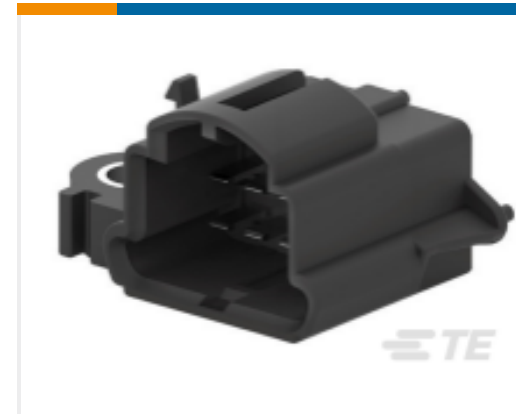
TE 产品编号1-963211-1 低和中等功率接头