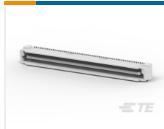
TE 产品编号1-5177986-5 Free Height Plug Connector: Board-Board, Vertical, 120, 0.8mm