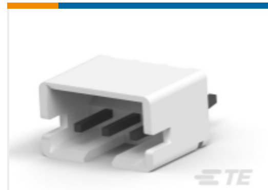
TE 产品编号1-1775469-3 AMP HPI 2.0MM 接头