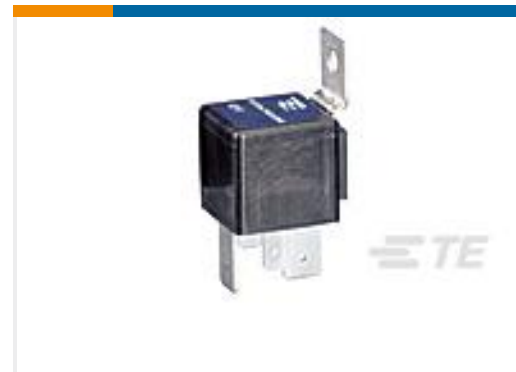
TE 产品编号1-1414147-0 V23134J0052X429-EV-CBOX