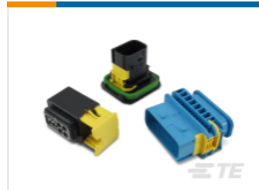
TE 产品编号2-1564532-1 重载密封连接器壳体