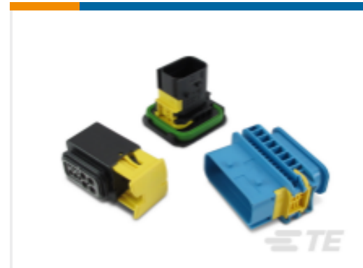
TE 产品编号2-1564532-1 重载密封连接器壳体