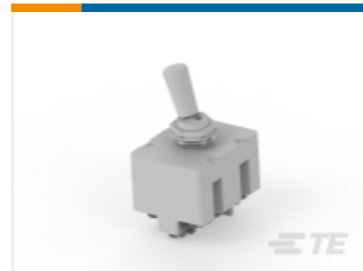
TE 产品编号K1002956 Toggle Switch 08-4-1-13