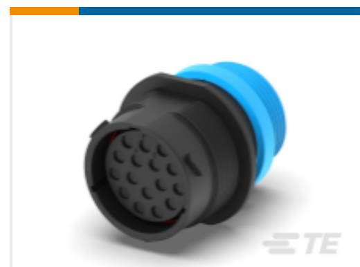
TE 产品编号HDP24-24-16SE-L015 REC, 16P, BLK, E, THD, 12, S