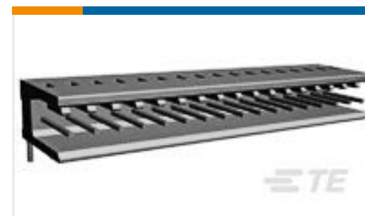
TE 产品编号1-826468-6 16P MOD II SHROUDED HEADER, RT ANG.