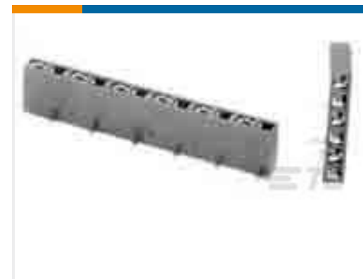
TE 产品编号1-966657-0 10P HV100 REC. CON, SMD, GOLD, TUBE PACK