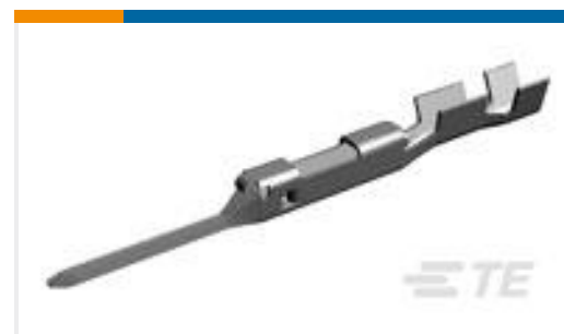
TE 产品编号1488220-1 MALE TERM. 18-20AWG, SN, RE-RE