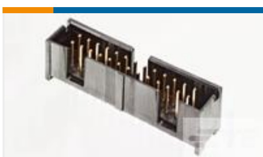
TE 产品编号103309-7 034 LOPRO HDR SP 30DP