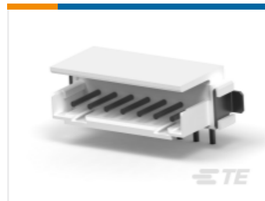
TE 产品编号2-292175-4 CT 盒公端 SMT : 垂直, 带罩