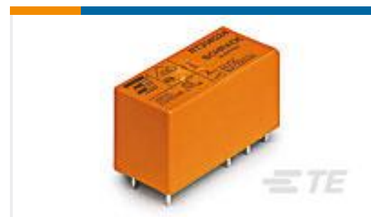
TE 产品编号2-1393240-9 RT33LF24