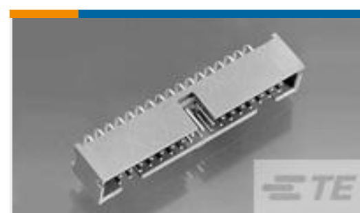
TE 产品编号5104340-9 A/L LOW PRO HDR 50P RA HT