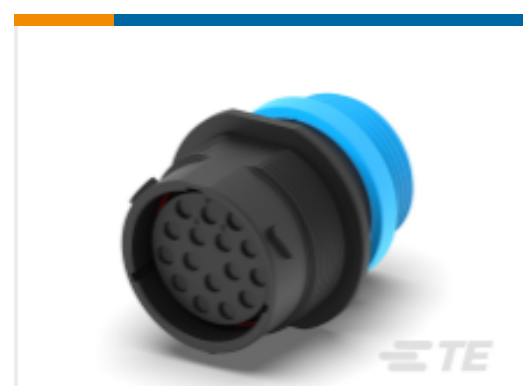
TE 产品编号HDP24-24-16SE-L015 REC, 16P, BLK, E, THD, 12, S