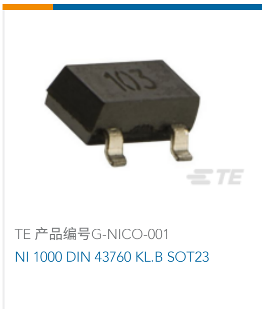
TE 产品编号G-NICO-001 NI 1000 DIN 43760 KLB SOT23