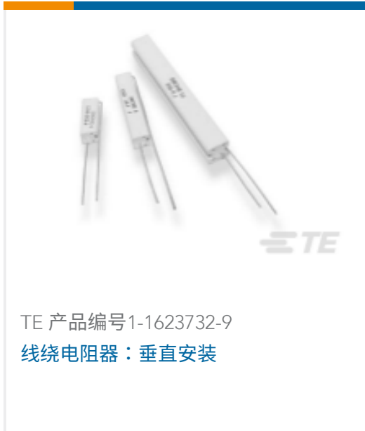
TE 产品编号1-1623732-9 线绕电阻器：垂直安装