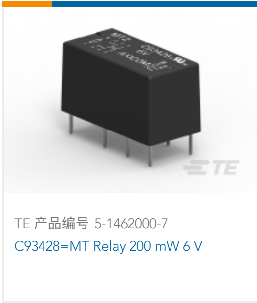
TE 产品编号 5-1462000-7 C93428=MT Relay 200 mW 6 V