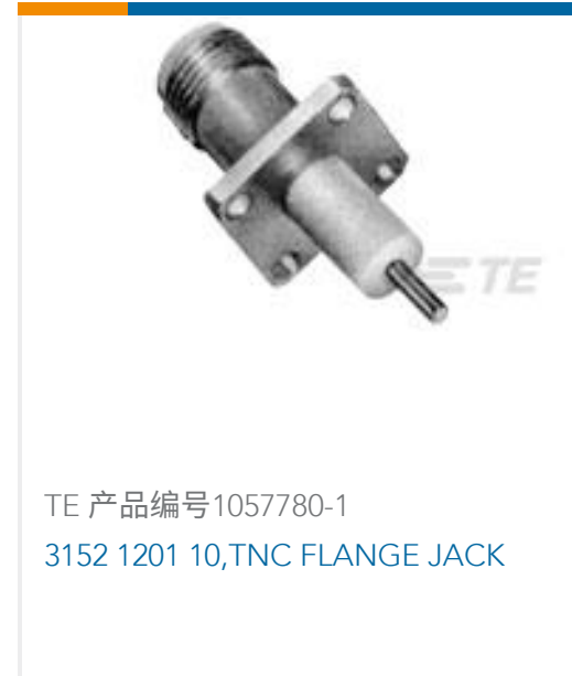
TE 产品编号1057780-1 3152 1201 10,TNC FLANGE JACK