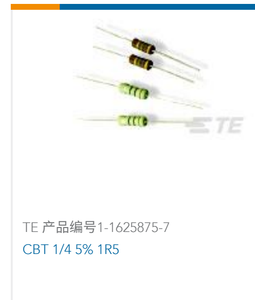
TE 产品编号1-1625875-7 CBT 1/4 5% 1R5