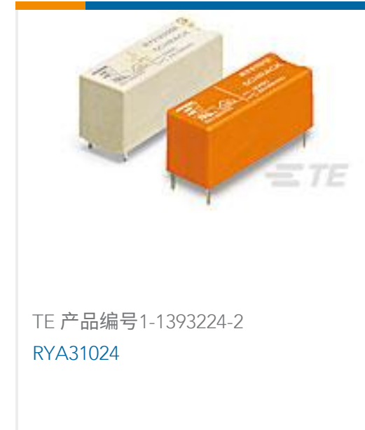
TE 产品编号1-1393224-2 RYA31024