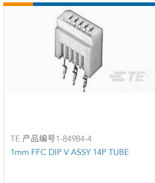
TE 产品编号1-84984-4 1mm FFC DIP V ASSY 14P TUBE