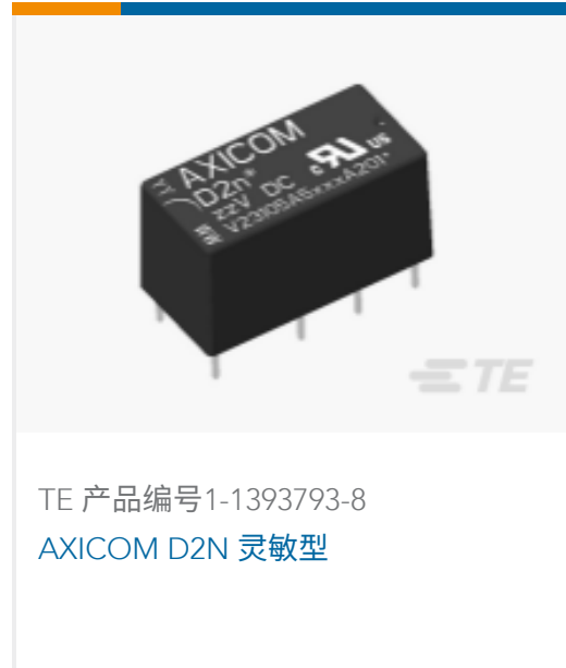
TE 产品编号1-1393793-8 AXICOM D2N 灵敏型