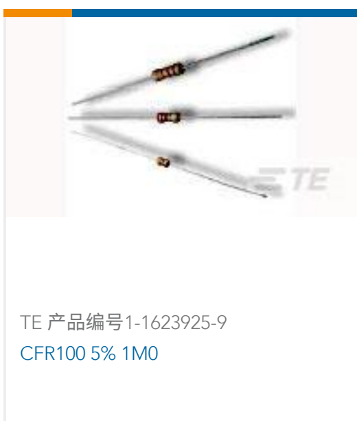
TE 产品编号1-1623925-9 CFR100 5% 1M0