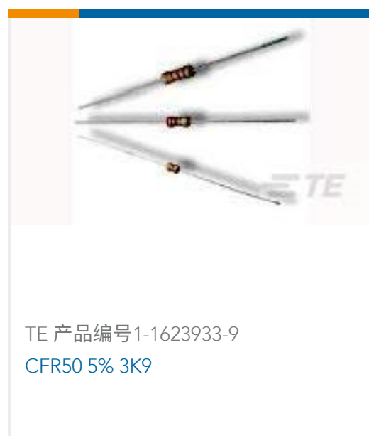
TE 产品编号1-1623933-9 CFR50 5% 3K9