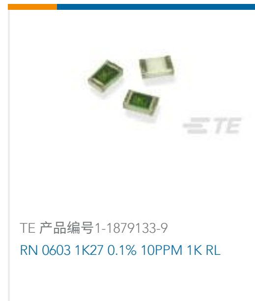
TE 产品编号1-1879133-9 RN 0603 1K27 0.1% 10PPM 1K RL