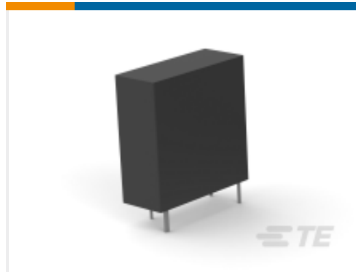
TE 产品编号9-1419125-2 STD OEG PCB PCFN 太阳能继电器