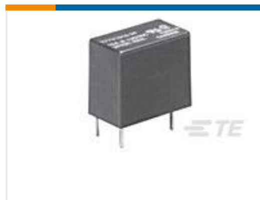
TE 产品编号2-1393194-7 T77V1D3-24