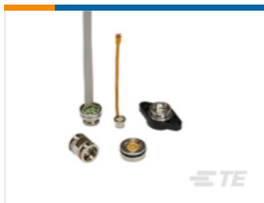
TE 产品编号154N-005G-RT 介质隔离式压力传感器库存列表