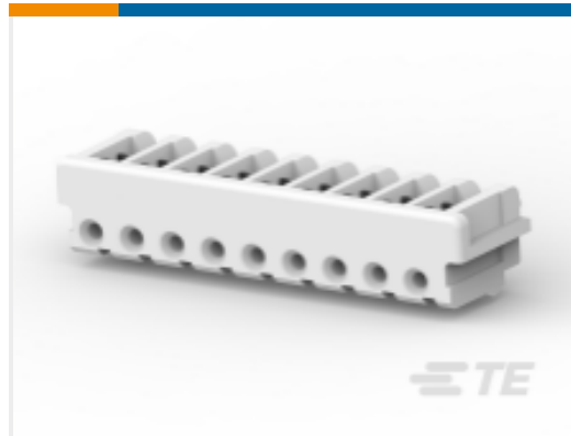
TE 产品编号179228-5 AMP 通用终端壳体