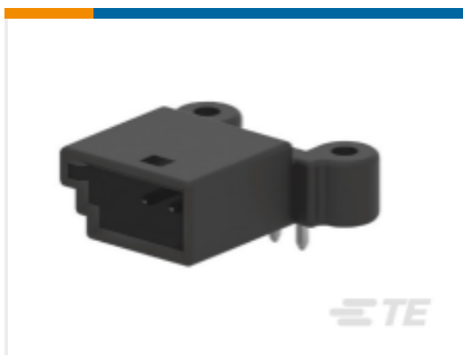
TE 产品编号1-1418773-1 信号接头