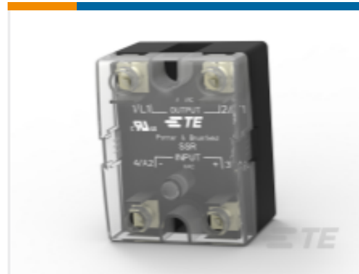
TE 产品编号1393030-7 P&B SSR 系列固态继电器