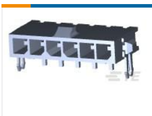
TE 产品编号2-1445054-6 MICRO MNL HDR ASSY S/ROW LF