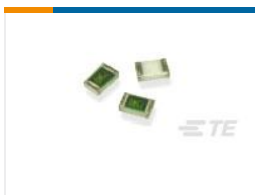
TE 产品编号1614349-1 RN 0603 10K 0.1% 10PPM 5K RL