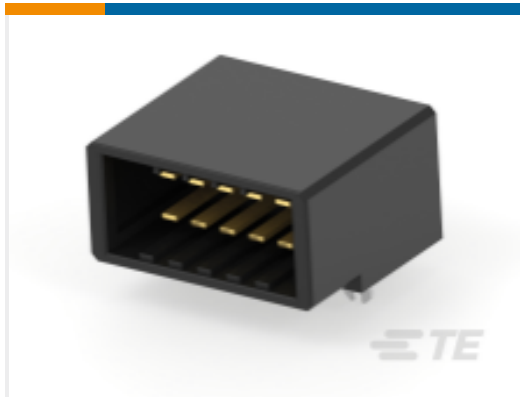
TE 产品编号178327-2 Dynamic 3100 HDR 组件