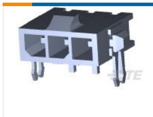
TE 产品编号2-1445054-3 MICRO MNL HDR ASSY S/ROW LF