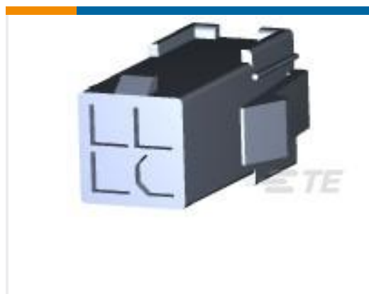
TE 产品编号1-172159-9 MINI UNIVERSAL M-N-L CAP 4P