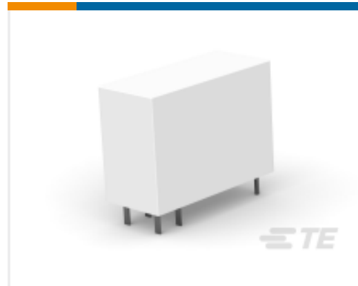
TE 产品编号1440002-5 STD SCHRACK RZF 功率继电器