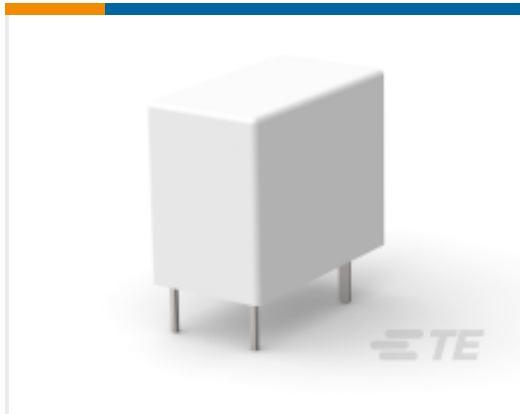
TE 产品编号1461403-4 STD OEG 小型 PCB OJ/OJE Pow 继电器