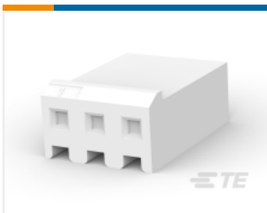
TE 产品编号1-647402-7 3.96mm Wire-to-board housing: receptacle, with mating alignment, SL 156