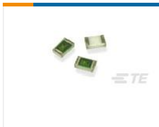
TE 产品编号9-1879028-2 RN 0805 475K 0.1% 10PPM 1K RL