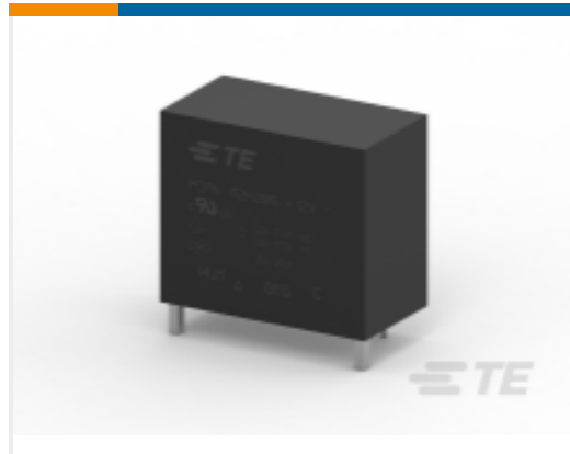
TE 产品编号1461353-2 PCFN 太阳能继电器