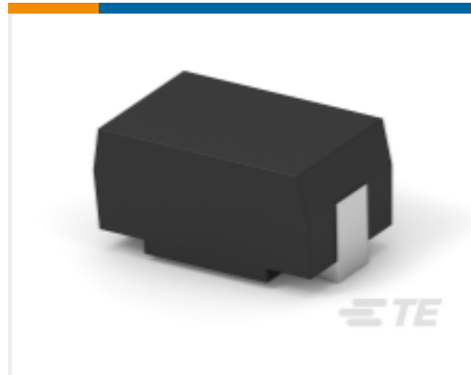
TE 产品编号1-1879234-5 SMD 功率电阻器 : 7 瓦特 , 200-2M 欧姆