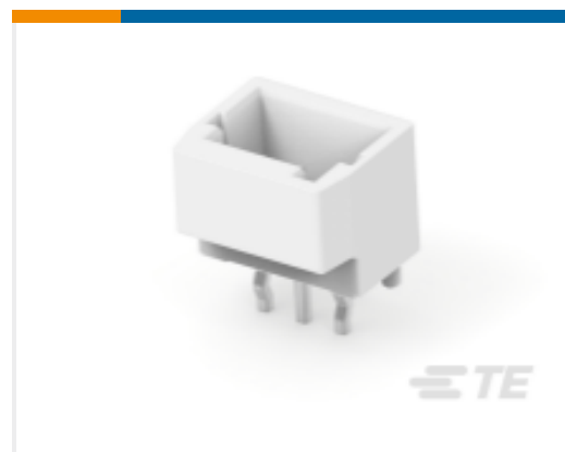
TE 产品编号1-2232826-3 SGI2.0 header assembly TH 3P,key A, NTL