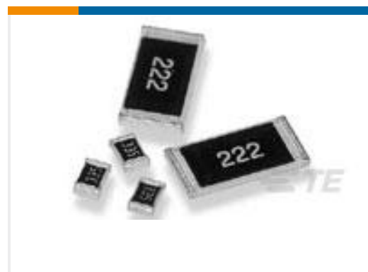
TE 产品编号9-1879512-8 CRGH0805 1% 220R 0.33W