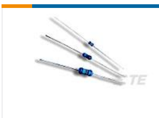
TE 产品编号1622217-1 LR0204 1% 330R