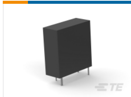
TE 产品编号1461267-1 STD OEG PCB PCFN 太阳能继电器