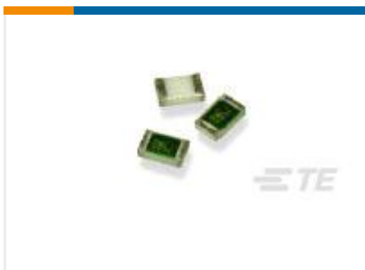
TE 产品编号1-2176216-4 CPF A 0603 120R 0.1% 25PPM 1K RL