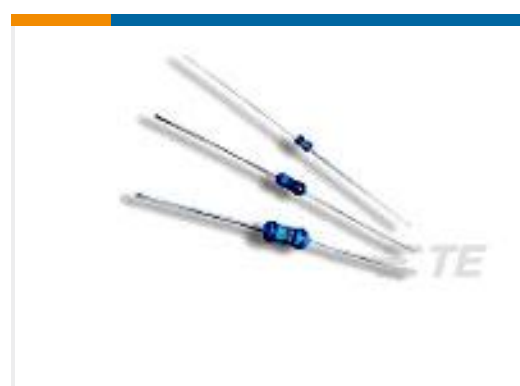
TE 产品编号1622279-1 LR0204 1% 7K5