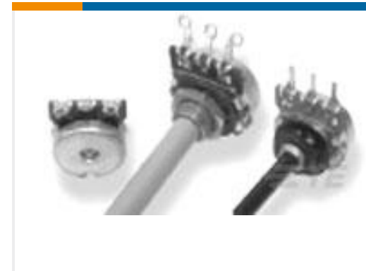
TE 产品编号1624182-2 27E DUAL 10KB 6.35X50FL CAT