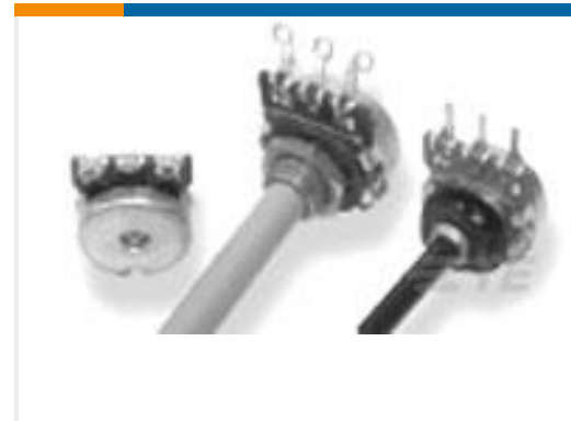
TE 产品编号1624156-2 23E 22KB 6.35X50FL B7 CAT