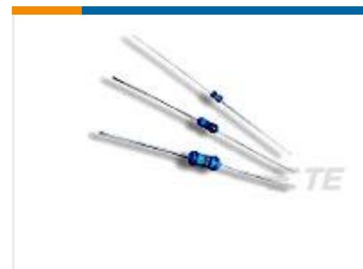
TE 产品编号1622210-1 LR0204 1% 2K4