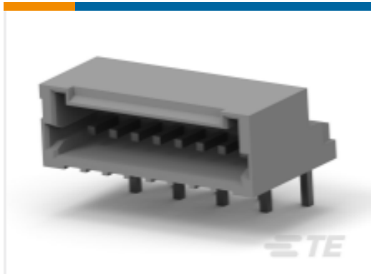
TE 产品编号1-292206-2 MINI 通用终端接头