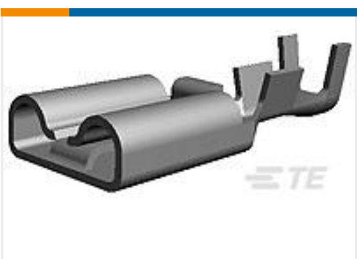
TE 产品编号175022-1 250 PL EX REC. 18-14AWG PTBR