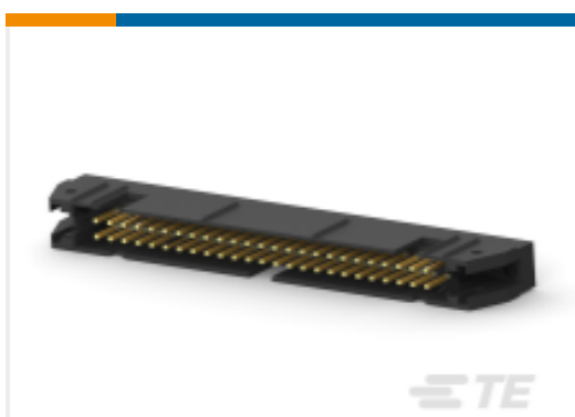
TE 产品编号1-5499206-1 AMP 锁门通用插头