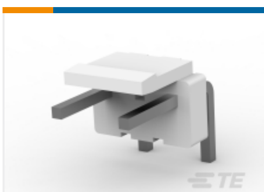
TE 产品编号1744525-3 EP 03P RA-HDR ASY NO 2 PIN