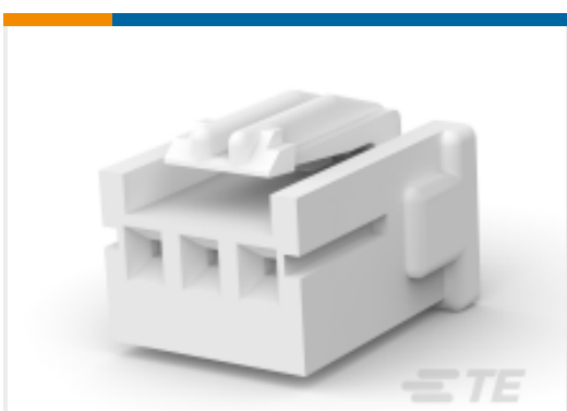
TE 产品编号917688-4 STD 温度信号双锁插头