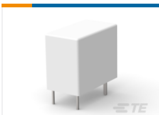
TE 产品编号1461403-4 STD OEG 小型 PCB OJ/OJE Pow 继电器