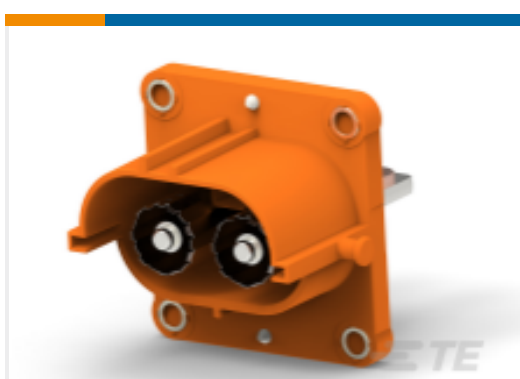
TE 产品编号1-2322122-2 HVP800 2P HEADER ASSY