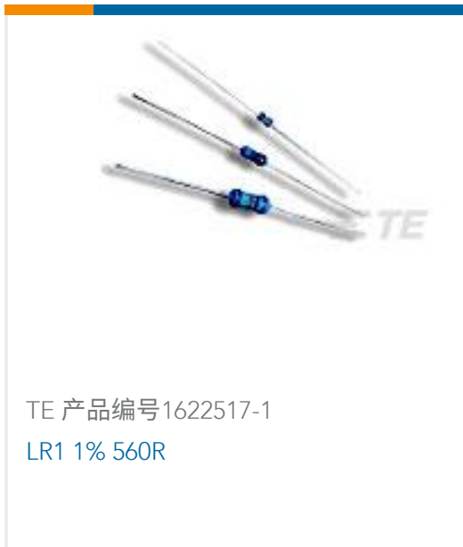
TE 产品编号1622517-1 LR1 1% 560R