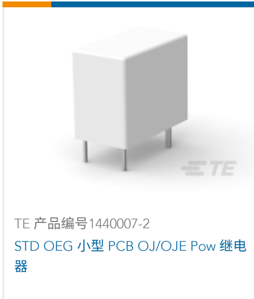
TE 产品编号1440007-2 STD OEG 小型 PCB OJ/OJE Pow 继电器