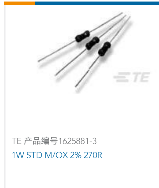
TE 产品编号1625881-3 1W STD M/OX 2% 270R