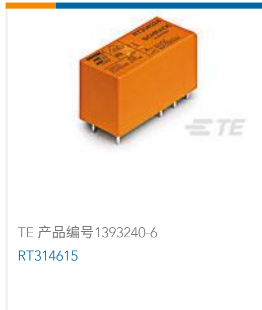
TE 产品编号1393240-6 RT314615