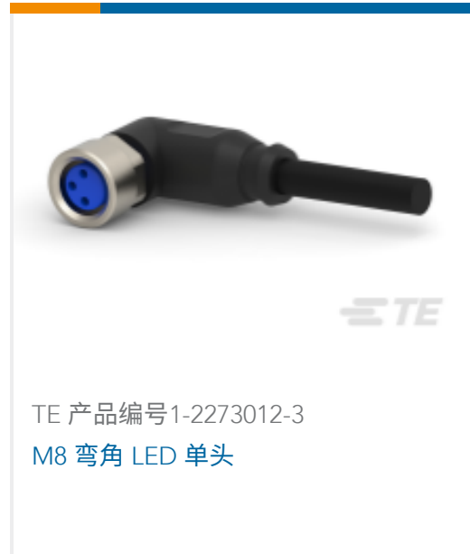
TE 产品编号1-2273012-3 M8 弯角 LED 单头