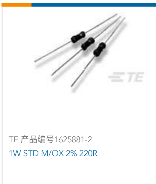
TE 产品编号1625881-2 1W STD M/OX 2% 220R