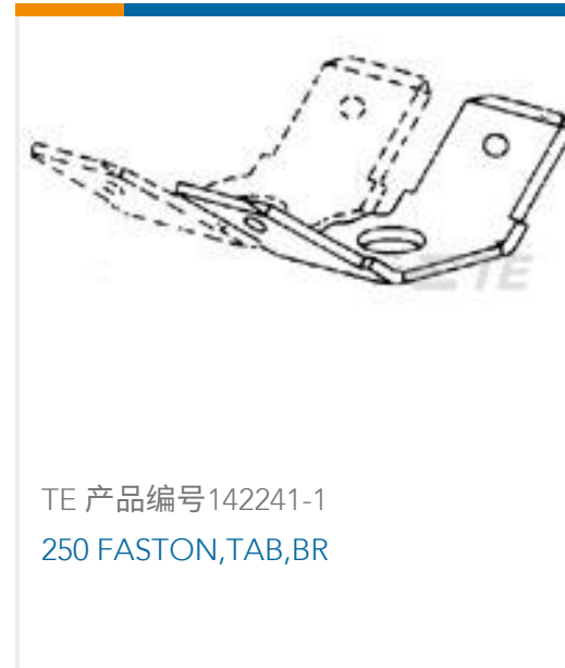
TE 产品编号142241-1 250 FASTON, TAB, BR