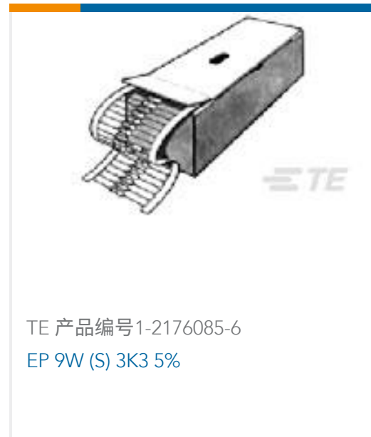
TE 产品编号1-2176085-6 EP 9W (S) 3K3 5%