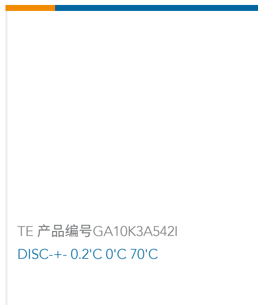
TE 产品编号GA10K3A542I DISC-+- 0.2°C 0°C 70°C