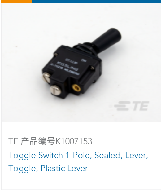
TE 产品编号 K1007153 Toggle Switch 1-Pole, Sealed, Lever, Toggle, Plastic Lever