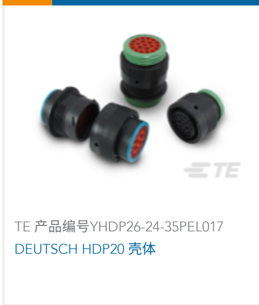
TE 产品编号 YHDP26-24-35PEL017 DEUTSCH HDP20 壳体