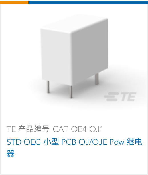
TE 产品编号 CAT-OE4-OJ1 STD OEG 小型 PCB OJ/OJE Pow 继电器