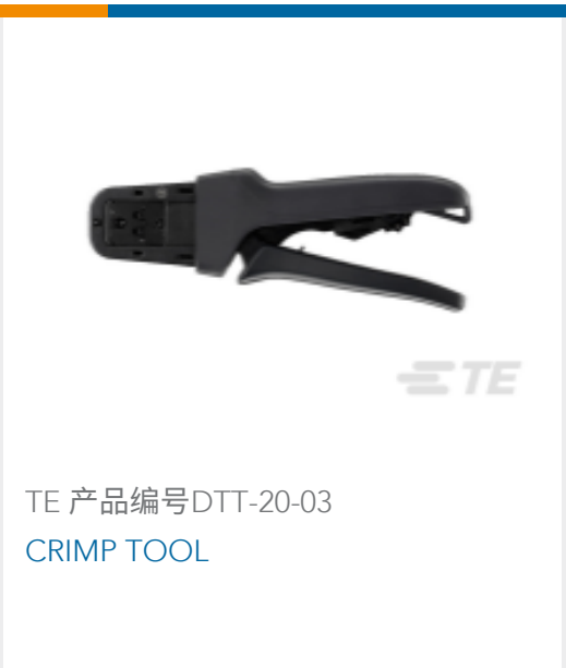
TE 产品编号 DTT-20-03 CRIMP TOOL