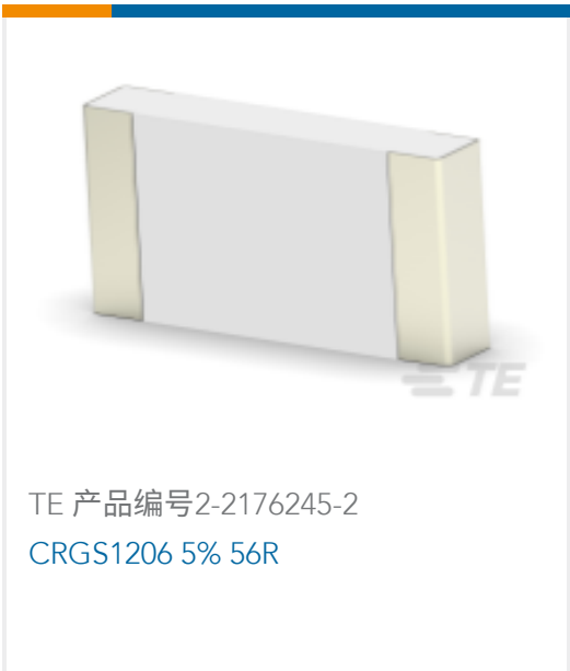
TE 产品编号 2-2176245-2 CRGS1206 5% 56R