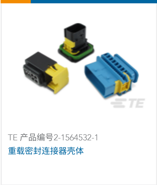
TE 产品编号 2-1564532-1 重载密封连接器壳体