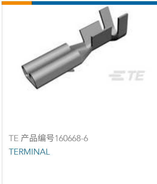
TE 产品编号 160668-6 TERMINAL