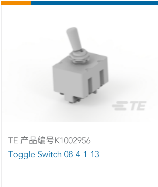
TE 产品编号 K1002956 Toggle Switch 08-4-1-13