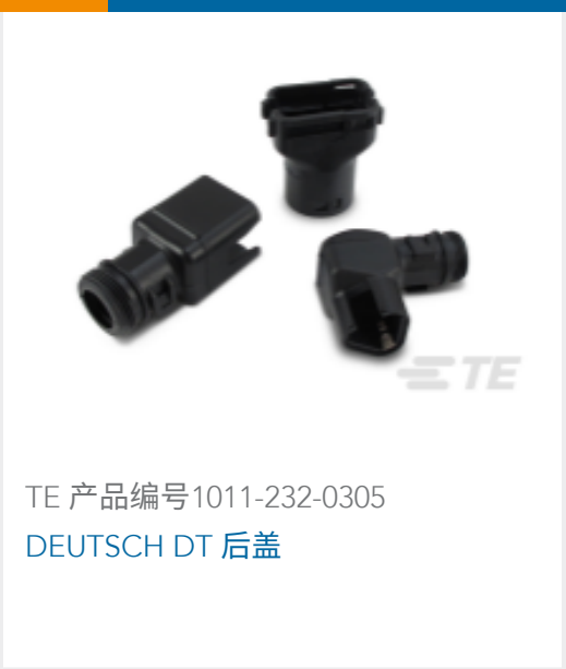
TE 产品编号 1011-232-0305 DEUTSCH DT 后盖