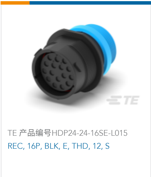
TE 产品编号 HDP24-24-16SE-L015 REC, 16P, BLK, E, THD, 12, S