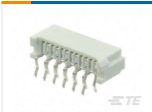
TE 产品编号1-84534-4 1.25mm FPC 连接器