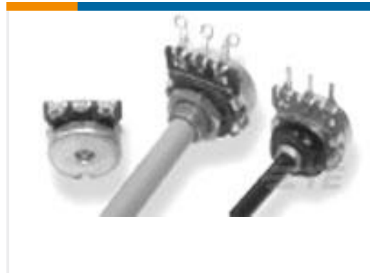
TE 产品编号1624133-1 23E 220KA 6X50PL B9 M10