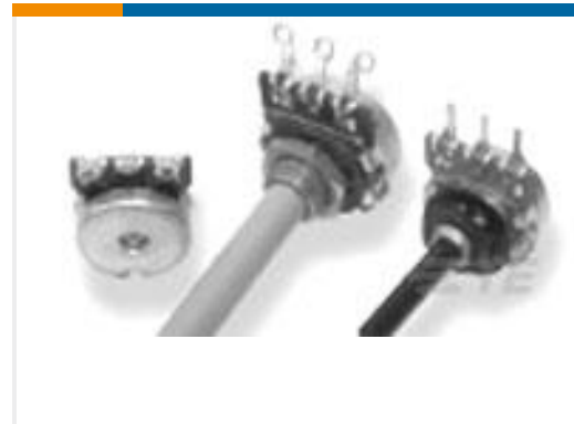
TE 产品编号1624182-2 27E DUAL 10KB 6.35X50FL CAT