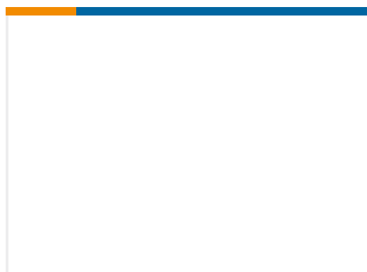
TE 产品编号G-MRCH-007 DIE MLS 5000 UNDCED