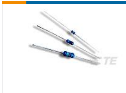
TE 产品编号1614991-1 LR0204 1% 130K