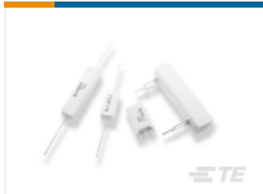
TE 产品编号1623795-3 线绕电阻器：水平安装