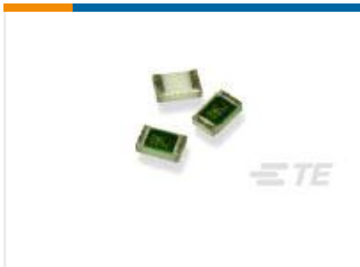
TE 产品编号1-2176217-2 CPF A 0805 36R 0.1% 25PPM 1K RL