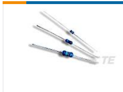
TE 产品编号1614996-1 LR0204 1% 13K