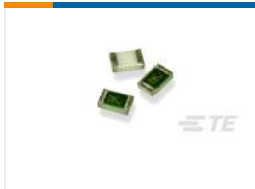
TE 产品编号1-1879417-3 CPF 0603 560K 0.1% 25PPM 1K RL